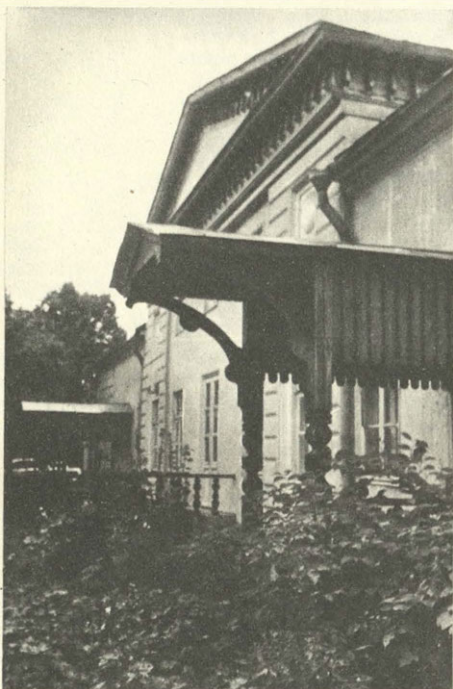
Крыльцо дома В. И. Даля.

Москва, улица Большая Грузинская, 4/6. Дом, в котором с 1859 по 1872 год жил и работал Владимир Иванович Даль. Здесь создавался «Толковый словарь живого великорусского языка». Памятник восстановлен при долевым участии Общества охраны памятников в 1972—1974 гг. (Автор проекта реставрации — В. А. Виноградов.)