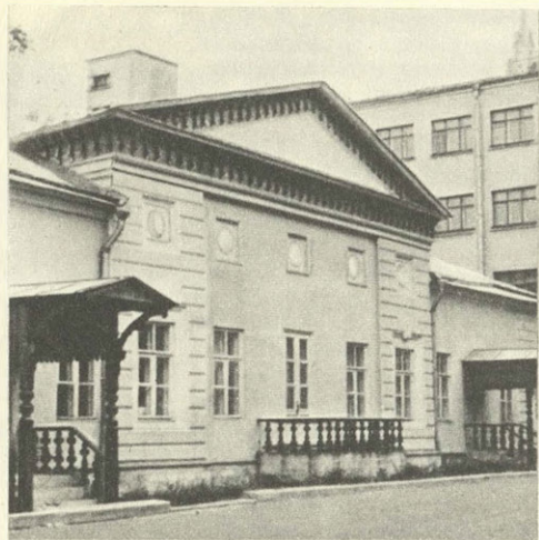
Москва. Большая Грузинская, 4. Дом В. И. Даля.

Москва, улица Большая Грузинская, 4/6. Дом, в котором с 1859 по 1872 год жил и работал Владимир Иванович Даль. Здесь создавался «Толковый словарь живого великорусского языка». Памятник восстановлен при долевым участии Общества охраны памятников в 1972—1974 гг. (Автор проекта реставрации — В. А. Виноградов.)