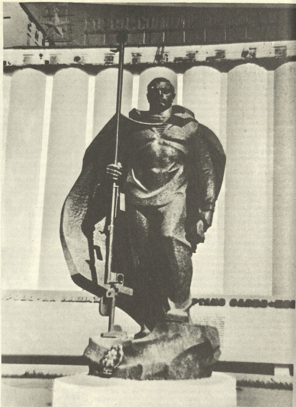
Волгоград. Памятник морским пехотинцам 92-й морской стрелковой бригады.

К 40-ЛЕТИЮ НАЧАЛА ВЕЛИКОЙ ОТЕЧЕСТВЕННОЙ ВОЙНЫ