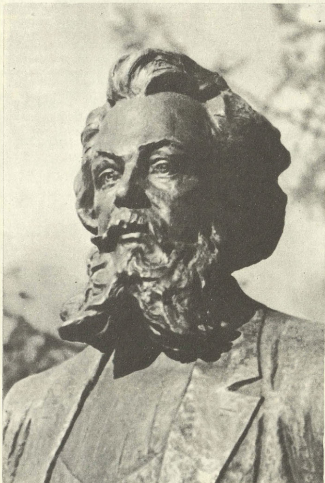
Псковская обл. Село Наумово.

(К 100-ЛЕТИЮ СО ДНЯ СМЕРТИ М. П. МУСОРГСКОГО)