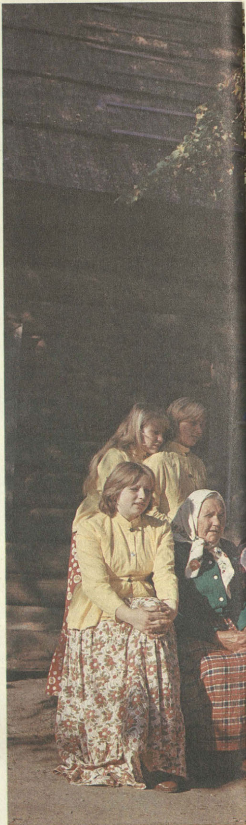
Фольклорный хор села Наумово.

Но, как ни отрадно, что весь просвещенный мир уделяет такое внимание Мусоргскому, главную ответственность