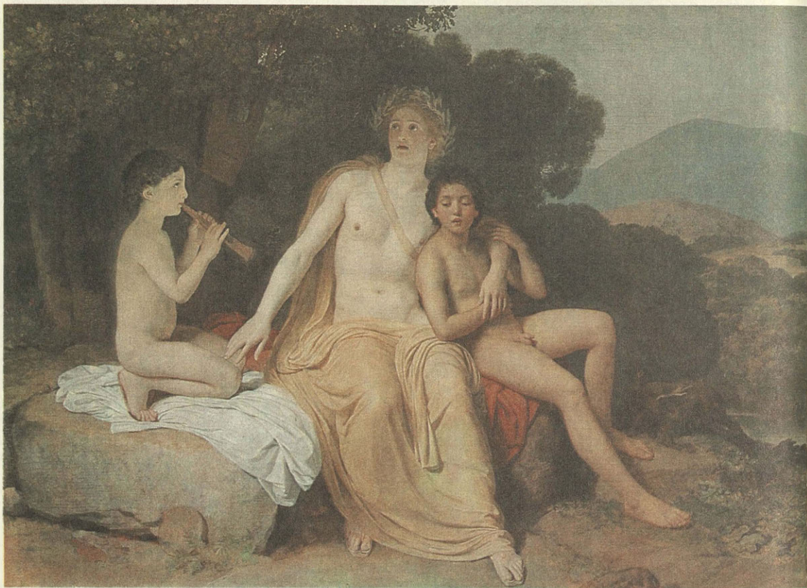
А. А. Иванов. «Аполлон, Гиацинт и Кипарис».

творчества Александра Иванова для отечественного искусства. И теперь, бывая в Третьяковской галерее или в Русском музее, я всегда прихожу в ивановский зал. Иду не любоваться живописью, вернее, не только любоваться, а коснуться душой чего-то чистого, возвышенного. Картина Иванова буквально околдовывает меня. Она заставляет отбросить все обыденное, забыть всякую суету, поднимает в мир высоких идей, увлекает какой-то особой правдой. Подобное ощущение перед ивановским полотном не покидает меня никогда. И я знаю — не только меня.