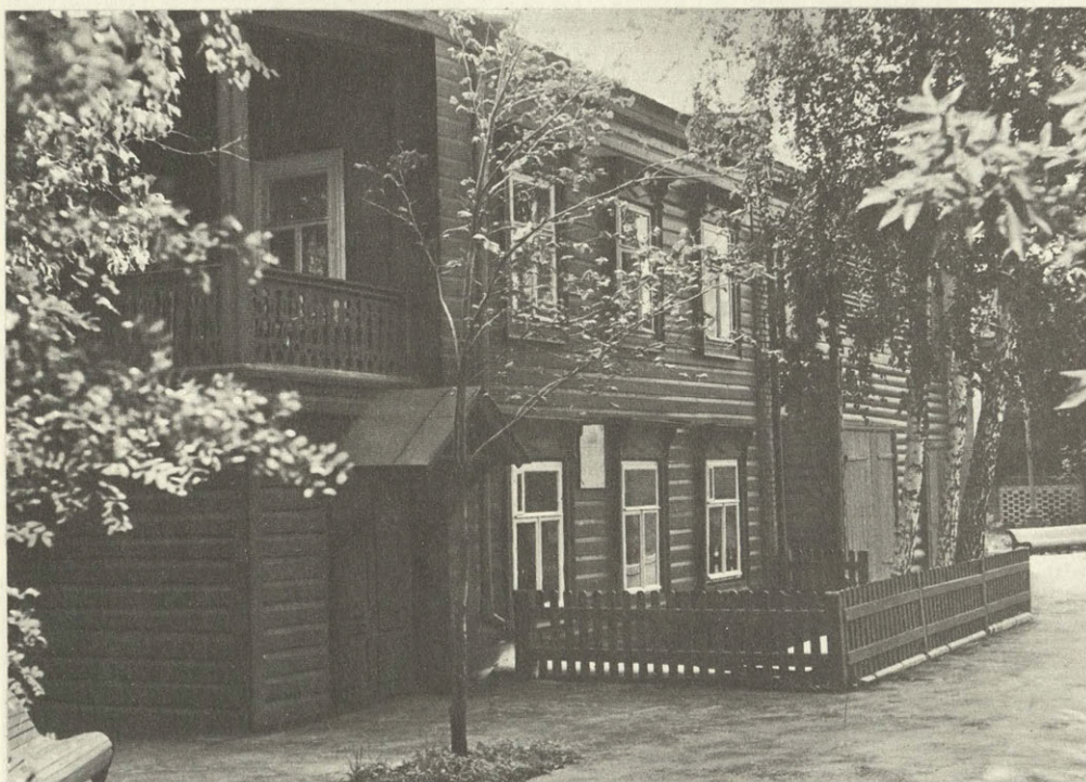
Псков. Дом-музей газеты «Искра».