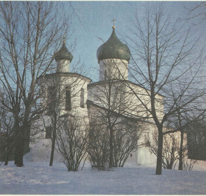
Псков. Церковь Никола со Усохи.

го ансамбля Псковского кремля, Довмонта города с неповторимой экспозицией памятников архитектуры и археологии под «открытым небом». Отреставрированы и музеефицируются Покровский историко-архитектурный комплекс XVI века в Пскове, ансамбли Псково-Печорской, Изборской, Порховской крепостей. Завершаются многолетние исследования архитектурно-археологических памятников Довмонта города и Трувора городища.