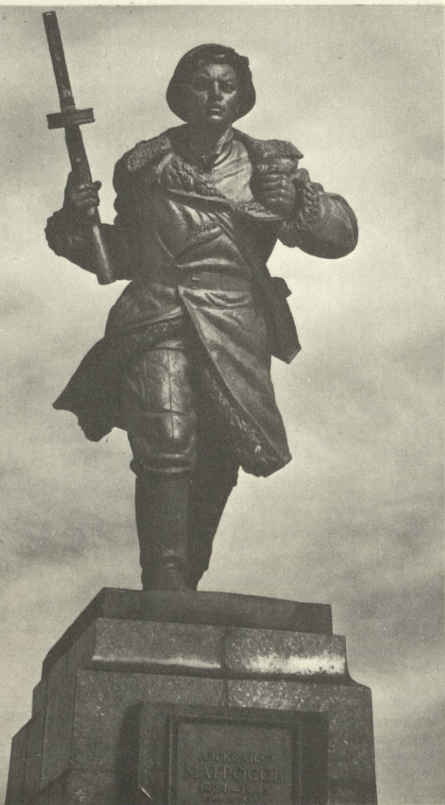
Великие Луки. Памятник Александрю Матросову.

бодительного движения: участницах Парижской коммуны Дмитриевой — Томазовской и Жаклар, декабристах Назимове, Шаховском, Горожанском и Коновницыне, революционерах-народниках Пе-