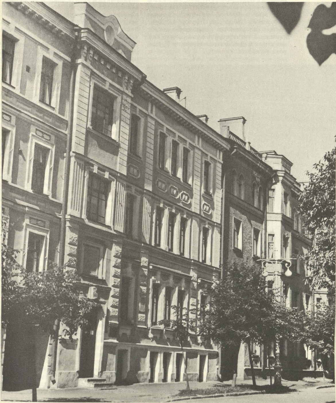
Псков. Дом, в котором находится музей-квартира В. И. Ленина.