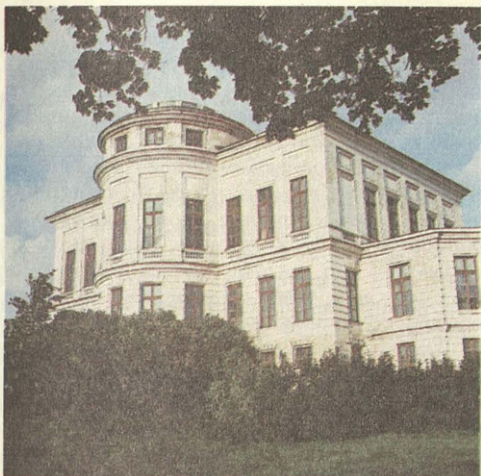
Вид на центральную часть Богородицкого дворца

Садово-парковому искусству принадлежит особое место в деятельности Болотова. Он создал и потом многократно расширял, улучшая, переделывая, парк в своем родном Дворянинове, разбивал парки в усадьбах своих родственников. В Богородицке, кроме большого парка, создал еще два.