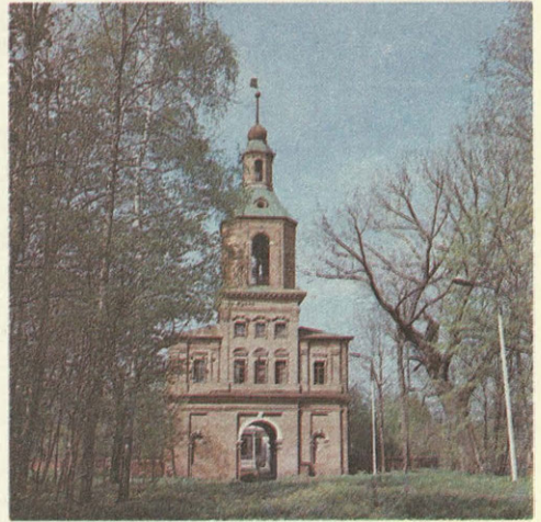
Въездная башня XVIII века.

Парк был наполнен всевозможными зданиями, сооружениями, хитроумными «затейми», на которые Андрей Тимофеевич был великий мастер. Одни имели большое значение для создания пейзажа, другие выполняли роль аттракционов для развлечения посетителей, Болотов ста-