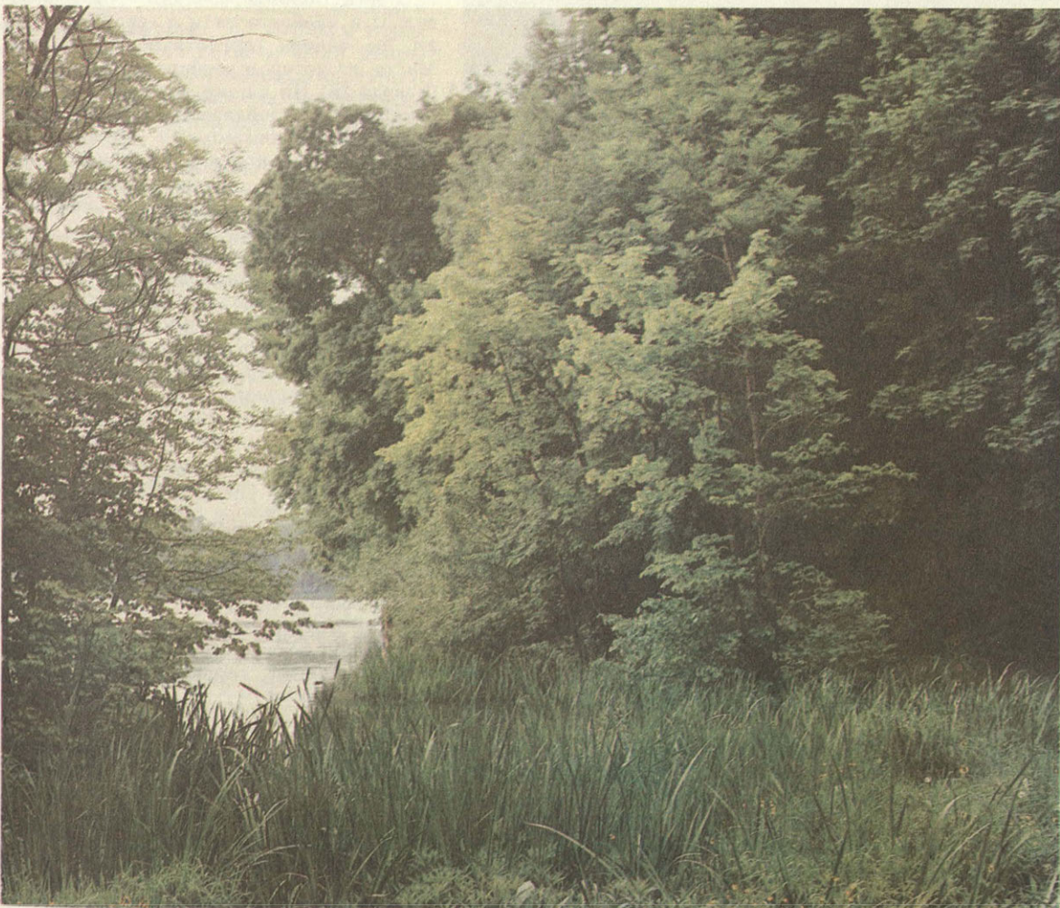
Уголок Богородицкого парка с прудом.

После постройки дворца и усадебной Казанской церкви Старов прислал план маленького регулярного парка для двор-