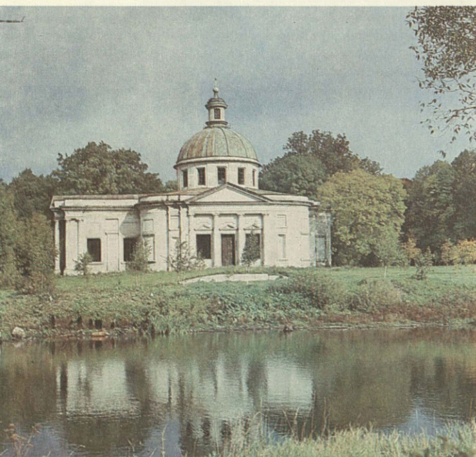
Богородицк. Казацкий храм в болотовском

Болотов уже до этого сам пришел к отрицанию регулярного стиля, непригодного, как он считал, для парка русской средней усадьбы. Книга Гиршфельда обогатила его знания о пейзажном, или, как тогда говорили, натуральном парковом стиле, сделала горячим приверженцем его.