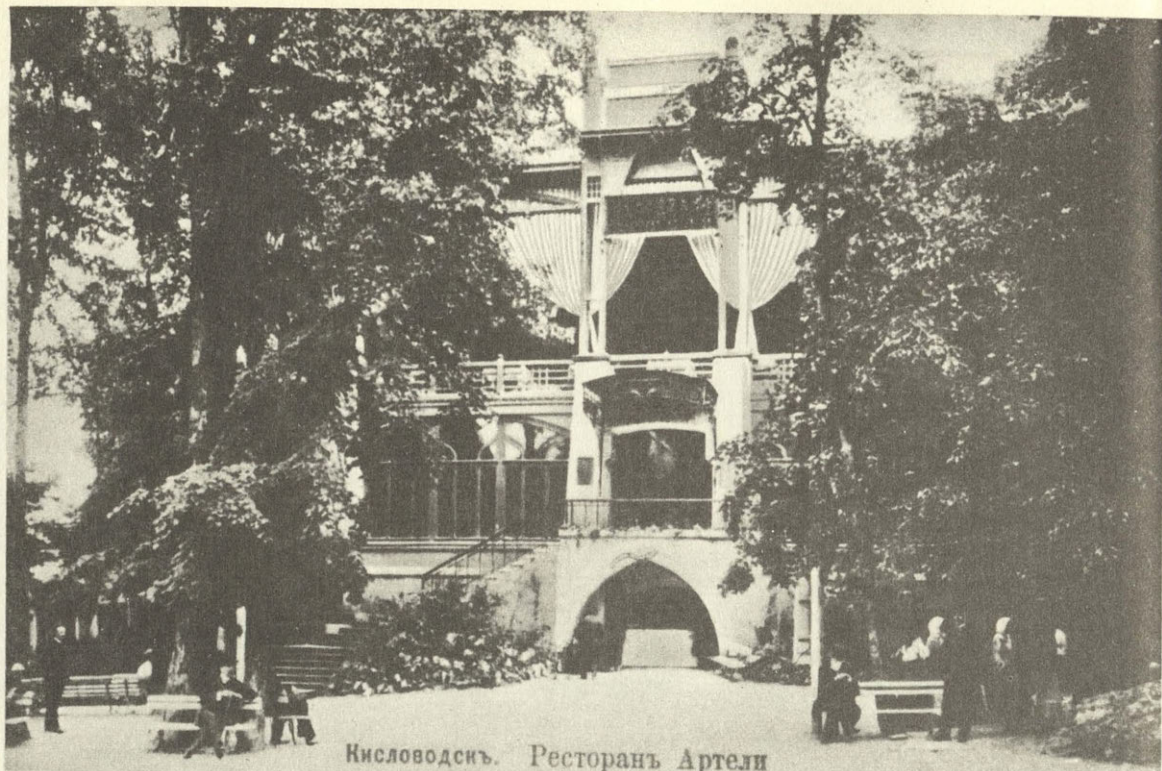
Фасад Ресторации в начале XX века.

лика здания Ресторации со двора. В альбоме видов, планов, чертежей, прилагавшемся к работе Ф. Баталина «Пятигорский край и Кавказские Минеральные Воды» (СПб, 1861) есть литография «Вид Кисловодска с горы Крестовой». На первом плане хорошо просматривается здание с внутренним двориком и навесом на колонках. Мнение, что это дворовый фасад Ресторации, подтверждает планировка здания (видимая на любом из ранних планов города) — в виде прямоугольника с боковыми пристройками со стороны дворового фасада (навес мог быть пристроен позже). Это мнение подтверждается еще и следующим. Около дворового фасада Ресторации мы видим ряды тополей. Сплошная посадка их обычно делалась вдоль дорог или широких аллей. О подъезде к зданию Ресторации со стороны двора пишет П. Савенко в 1828 году: «К строению сему дорога для колес идет по северной стороне холма, а для пешеходов устроена красивая лестница» 2 .