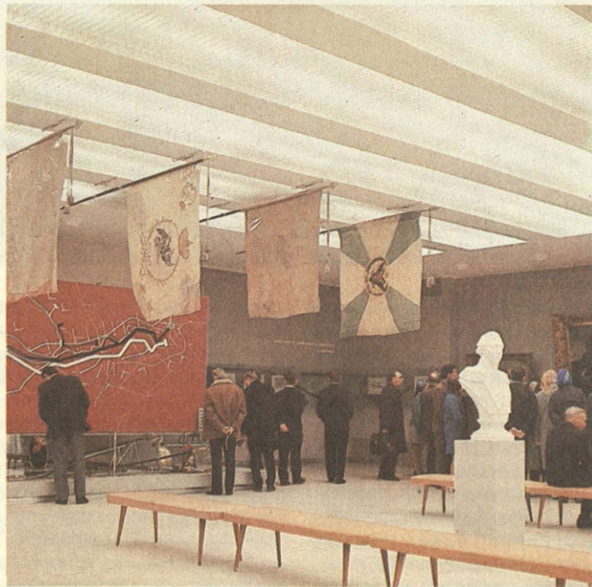
В залах музея «Бородинская битва».

Не иссякает поток посетителей музея. Попасть сюда трудновато — редкий день у дверей музея нет многолюдной очереди. Творчество Франца Иосифовича Рубо выдержало испытание временем. Оно — живительный источник патриотизма советских людей.