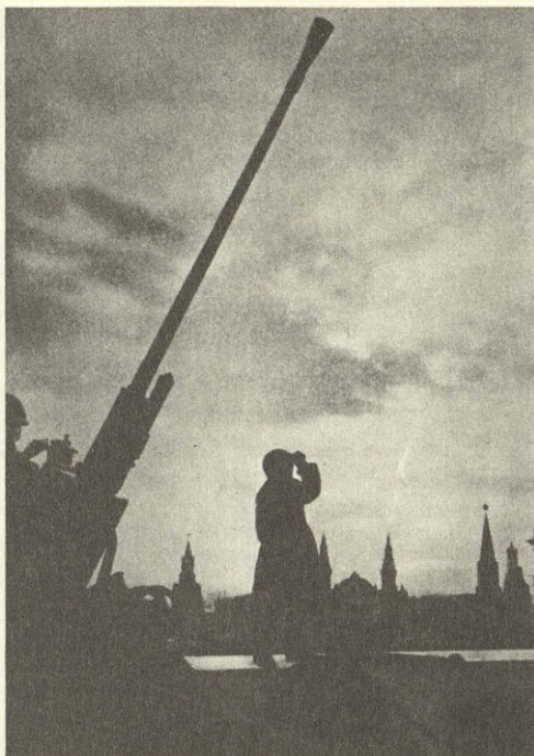
На страже московского неба. 1941 год.

Кроме того, по планам гитлеровцев намечалось перед захватом разрушить Москву артиллерийским огнем и бомбовыми ударами. Доложив Гитлеру о планах окружения Москвы, начальник Генерального штаба Гальдер записал: «Непоколебимо решение фюрера сровнять Москву и Ленинград с землей, чтобы полностью избавиться от населения этих городов, которое в противном случае мы потом будем вынуждены кормить в течение зи-