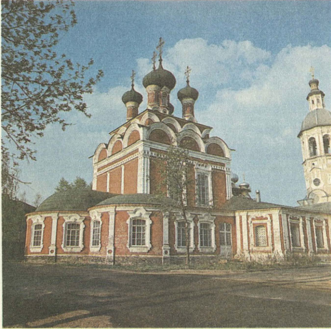
Осташков. Троицкий собор после реставра- ции. XVII век.