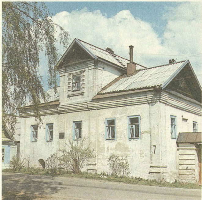
Осташков. Самый древний дом города.

Не меньшим бедствием, чем топор, для водоохранных лесов является, как ни странно, турист. Сейчас на верхневолжских озерах более десяти туристических баз, в недалеком будущем их станет больше: бассейн озер объявлен республиканским курортом, планируется формирова-