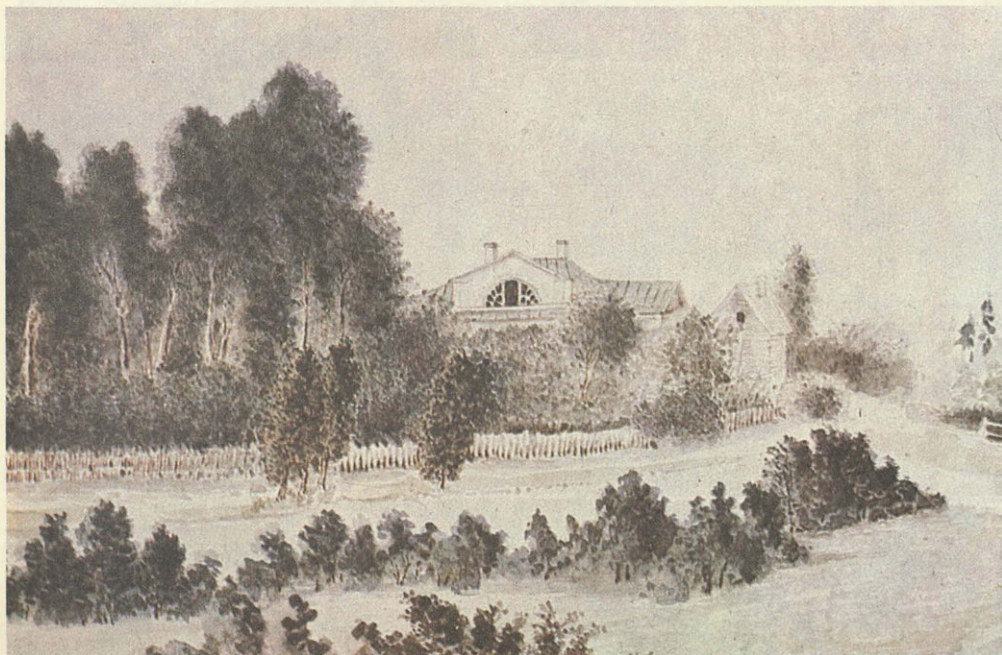
Шахматове. Акварель А. Н. Бекетова. 1880-е годы.