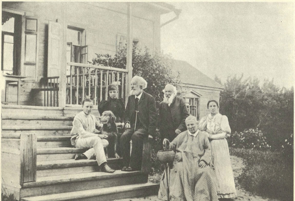
А. А. Блок со своими родными и близкими на балконе шахматовского дома. Фото 1911 года.

Долго бродил я по безлюдным лесным тропинкам и полянам, пока случайно не встретил собиравшую в лесу грибы старую женщину. Тяжело ступая, она подвела меня к совер-