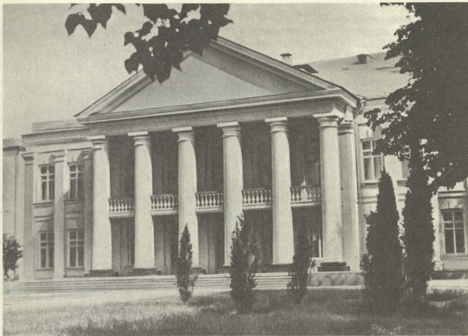
Волга. Театр юного зрителя. В этом здании выступал М. И. Калинин.

духовной красоты, ту гармонию духовного и телесного, к которой надо стремиться. Благодаря этому достигнута огромная сила воздействия живописи на зрителя.