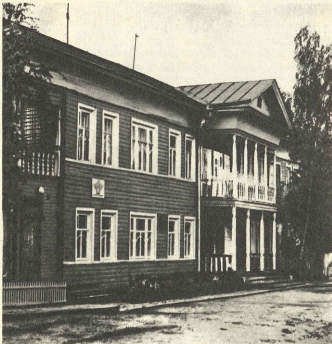
Вологда. Дом-музей М. И. Ульяновой.