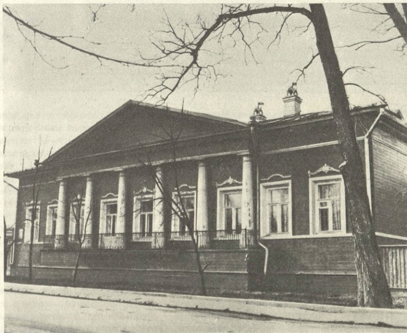
Вологда. Дом Волкова. Образец ампирной застройки.

В целях увековечения памяти о пребывании семьи В. И. Ленина в Вологде