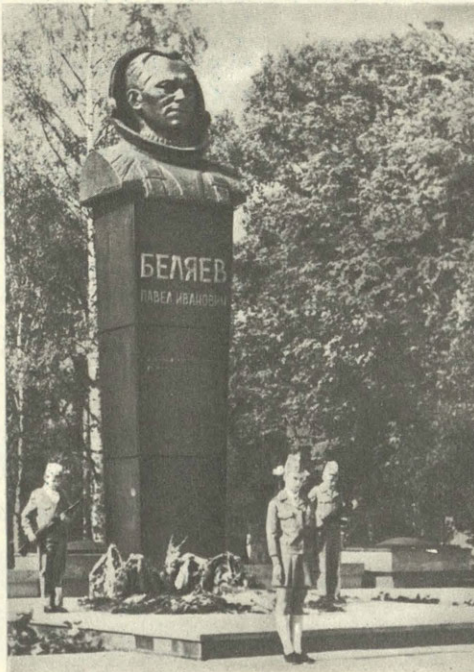
Вологда. Памятник космонавту П. Беляеву.

Палитра росписи Дионисия чрезвычайно богата, разнообразна и многоцветна. Он всемерно высветлял свою гамму, вводил светлые краски, отчего живопись его приобрела особую прозрачность и серебристость. Дионисий показал себя прекрасным мастером синтеза живописи с архитектурой. В удивительно совершенных образах Дионисий показал идеал