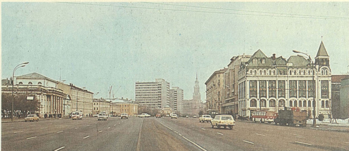
Садово- Спасская улица.