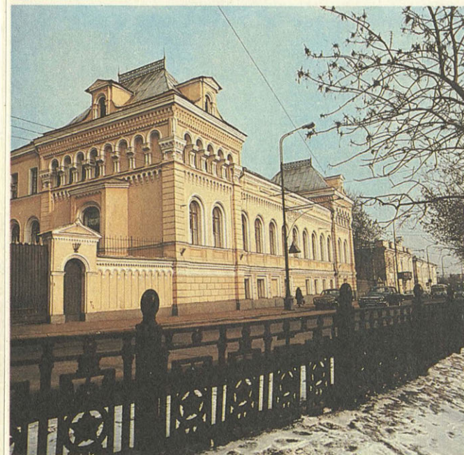
Чистопрудный бульвар. Историческая застройка.