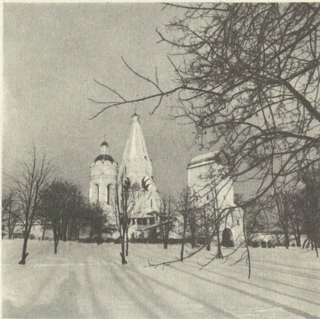
Ансамбль в Коломенском.

Садовое кольцо, как и улица Горького, — это московские примеры воплощения принципов советского градострои-