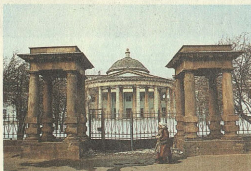
Садовое кольцо. Детский кукольный театр.