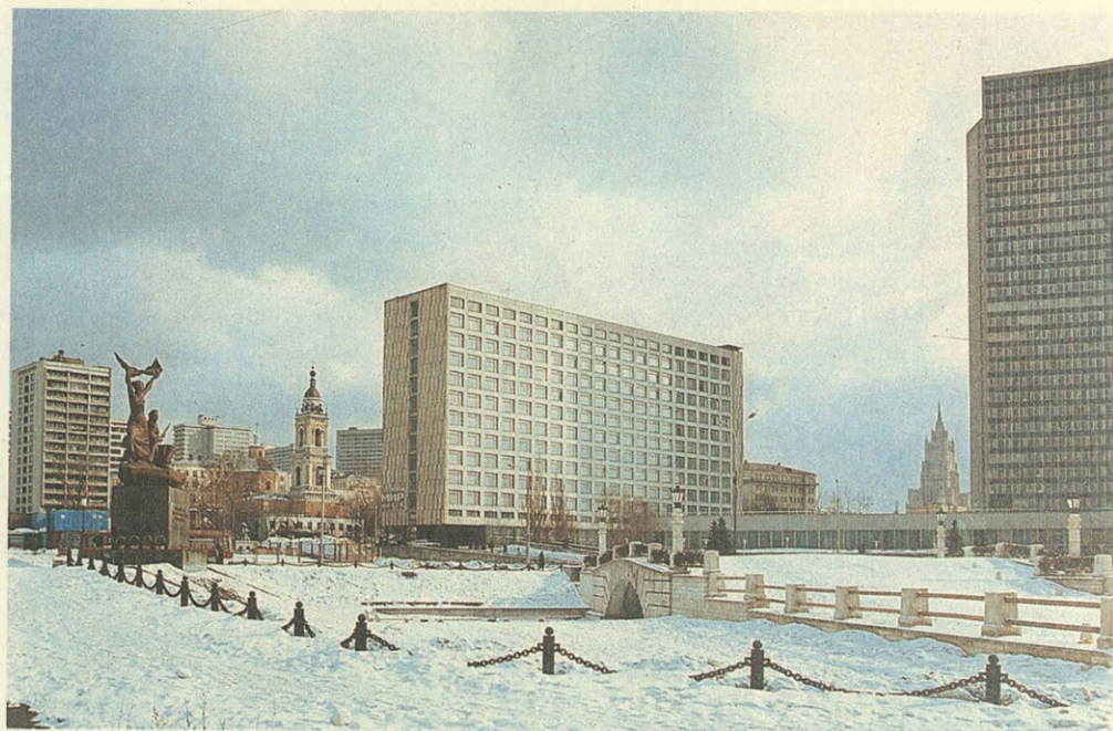
Музей Декабрьского вооруженного восстания на Красной Пресне.