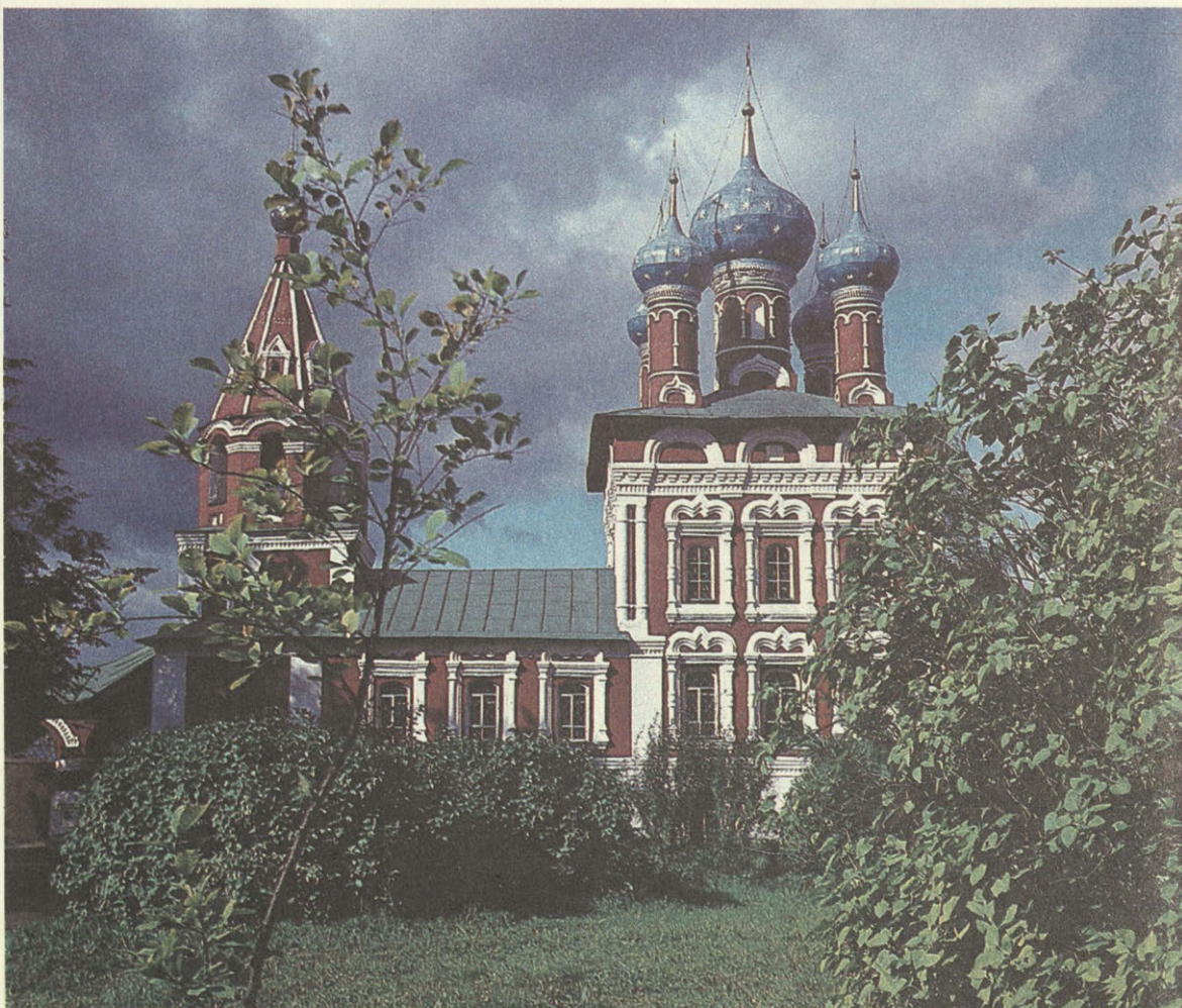
Храм царевича Димитрия. XVII век.