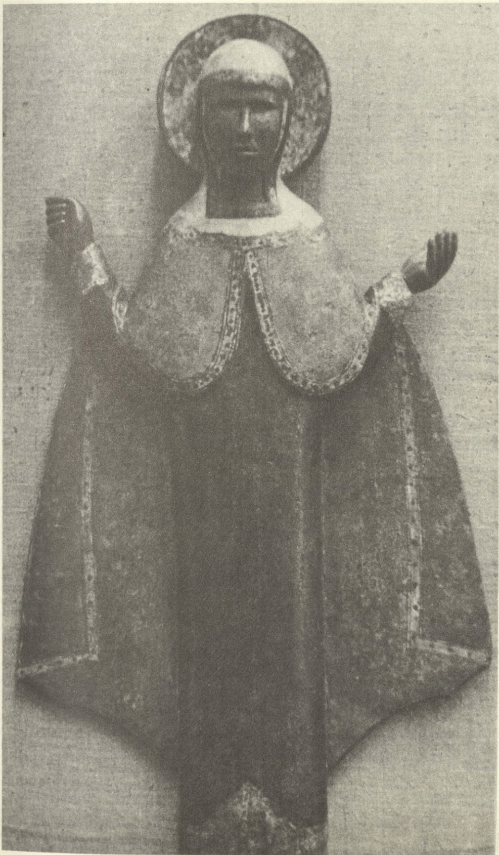
Параскева- Пятница. Деревянная скульптура из угличского музея.