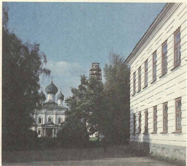
Историческая застройка Углича.

менты, и до нашего времени дошло очень мало многошатровых храмов.