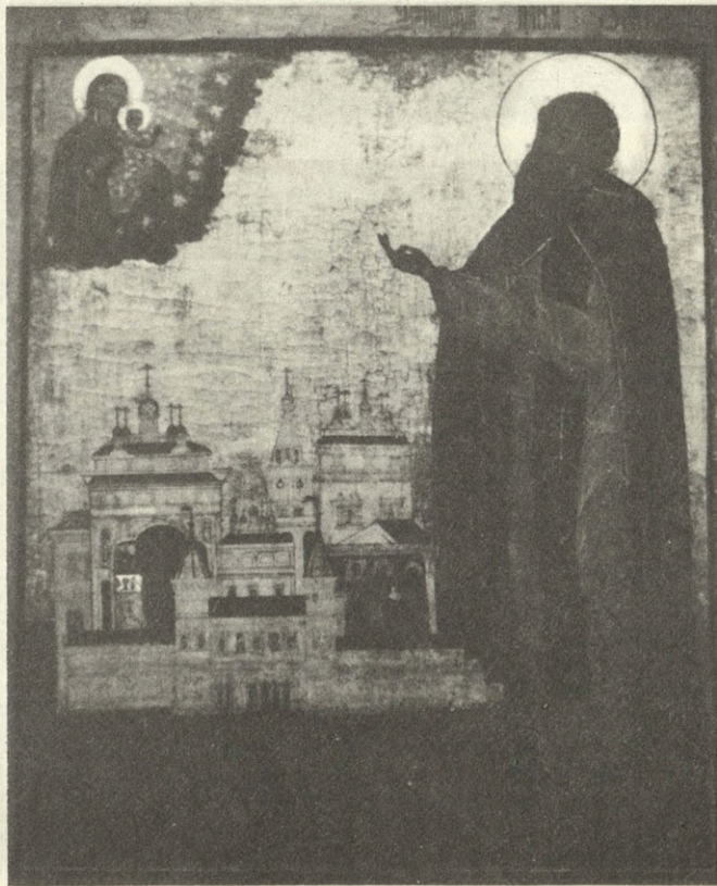
Памятник архитектуры XVI в. церковь «Дивная».

За многовековую историю Углича на долю города выпадали и периоды расцвета, и времена величайших страданий и разорения. Полностью сжигался и разорялся он татаро-монголами в 1238 году, тверским князем Михаилом в междоусобной войне 1371 года, польскими интервентами в 1608—1612 годах. Гибель царевича Дмитрия в 1591 году, пожалуй, последнее крупное событие в дореволюционной истории города. Некогда богатый и многолюдный, до сорока тысяч человек, Углич стал хиреть. В 1724 году он стал уездным центром. В первом путеводителе по городу, изданном в 1912 году, сказано: «Углич — сонный городок на Волге... Слава прожита, и не верится, что на ста-