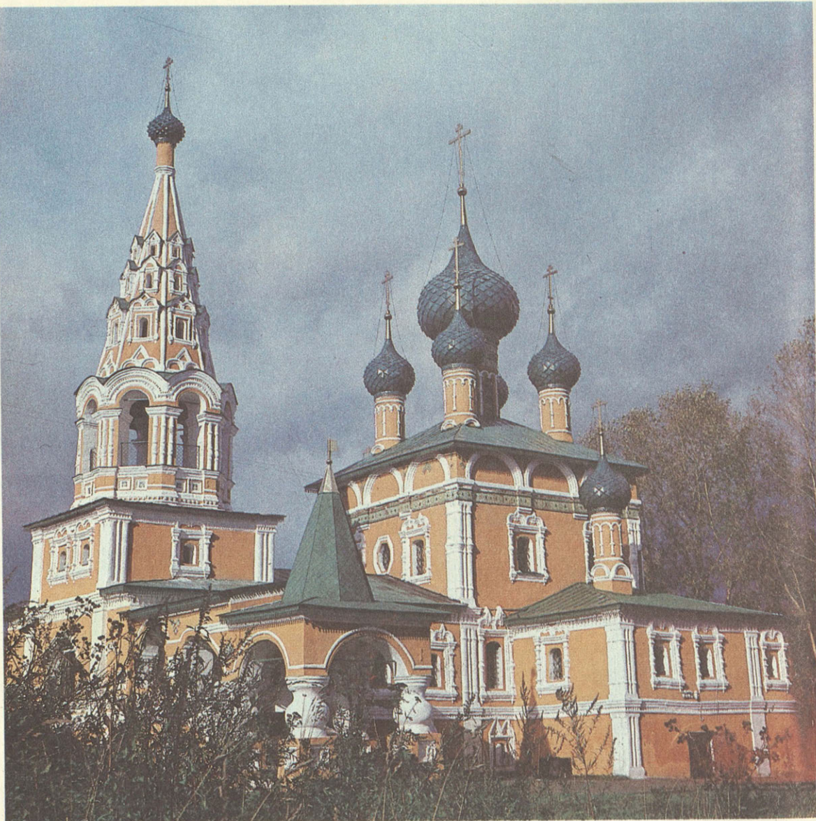
Храм Иоанна Предтечи. Памятник конца XVII века.

и ее угличского участка в городе выполнен значительный объем реставрационных работ. Спасены от разрушения и отреставрированы Воскресенский монастырь, церкви Федоровская, Корсунская, Смоленская, Спасо-Преображенский собор, выведена из аварийного состояния и отреставрирована «Дивная» церковь. Ведутся работы по реставрации Казанской церкви и кремлевской колокольни, дома Меховых-Ворониных. Восстановлены иконы иконостаса Спасо-Преображенского собора, коллекция портретов начала XIX века кисти местного художника Ивана Тарханова, ряд других произведений искусства из запасников музея. В возрождении памятников