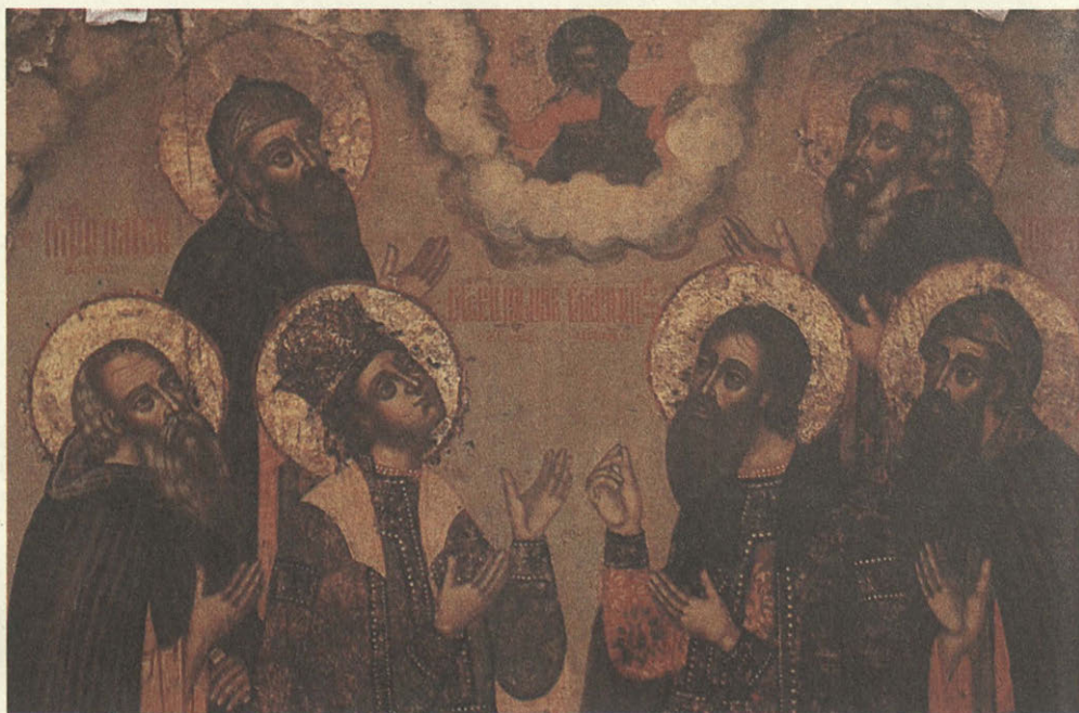
Икона XVIII в. Угличские чудотворцы. На иконе изображен царевич Дмитрий.