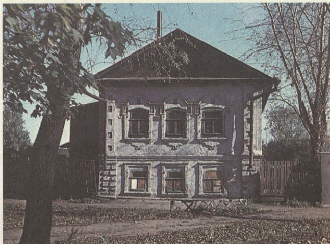
Здание исторической застройки Углича — дом Калашниковых. XVIII век.