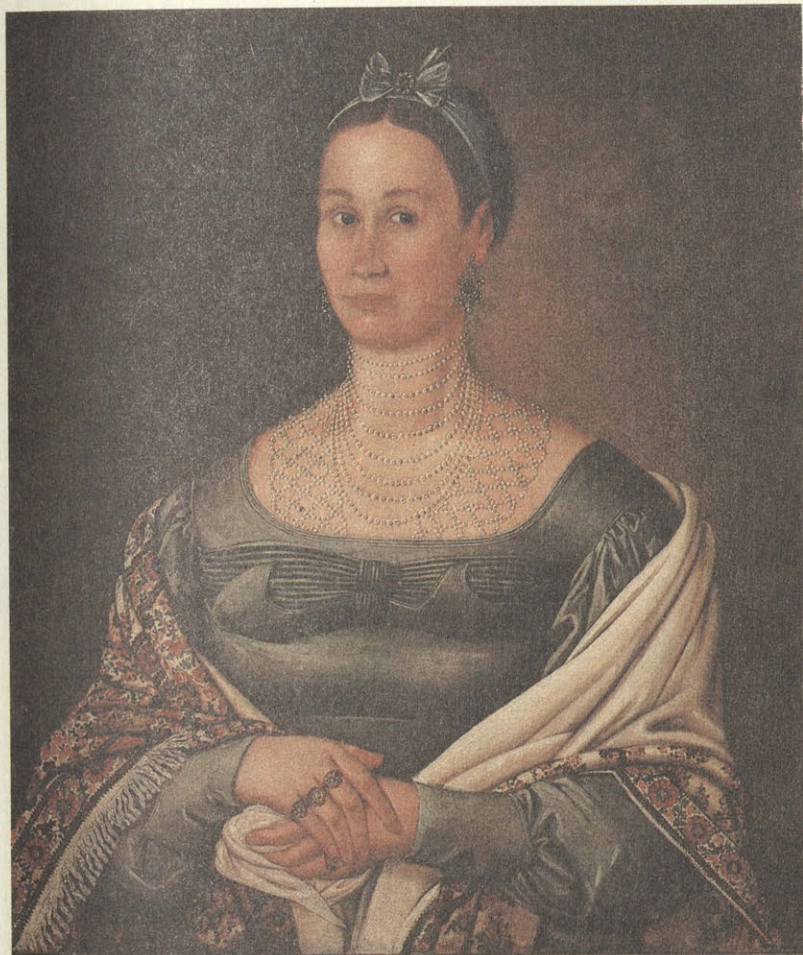
И. Тарханов. Портрет Шапошниковой.