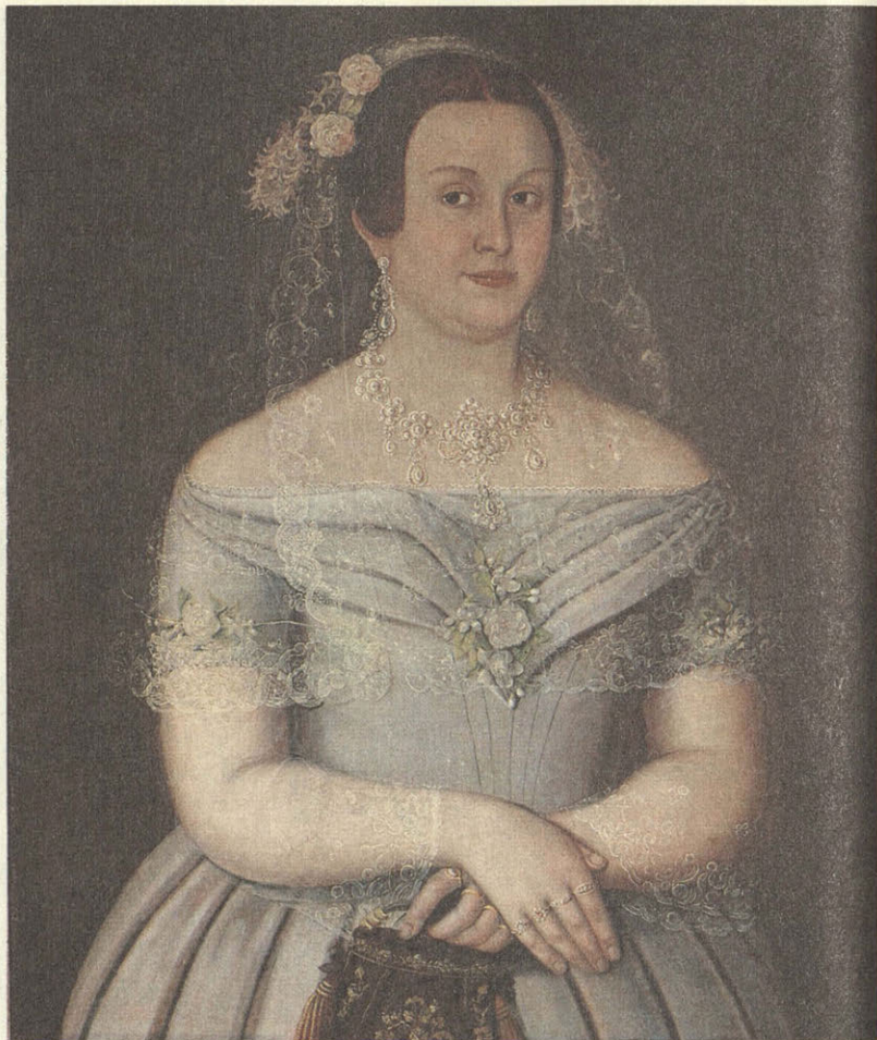
И. Тарханов. Портрет П. М. Сурина до и после реставрации.