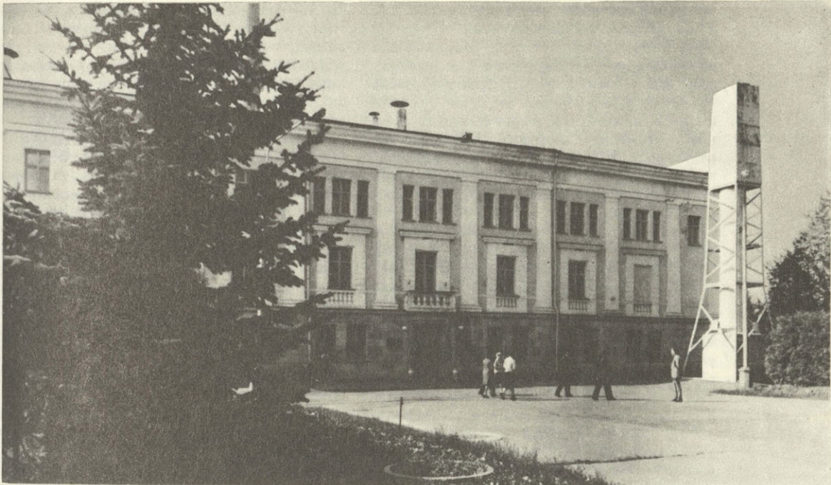
Здание первой атомной электростанции в Обнинске.

Н. А. Доллежалъ, академик, Герой Социалистического Труда, лауреат Ленинской и Государственных премий