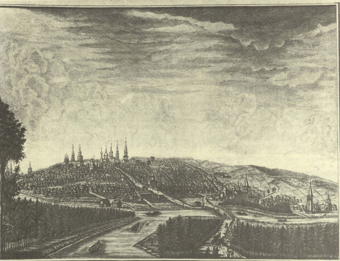
Видъ города ПЕНЗЫ на Суру р.къъ съверо-востоку. Vue de la Ville de PENZE sur la Soura du côté du Nord-Est.