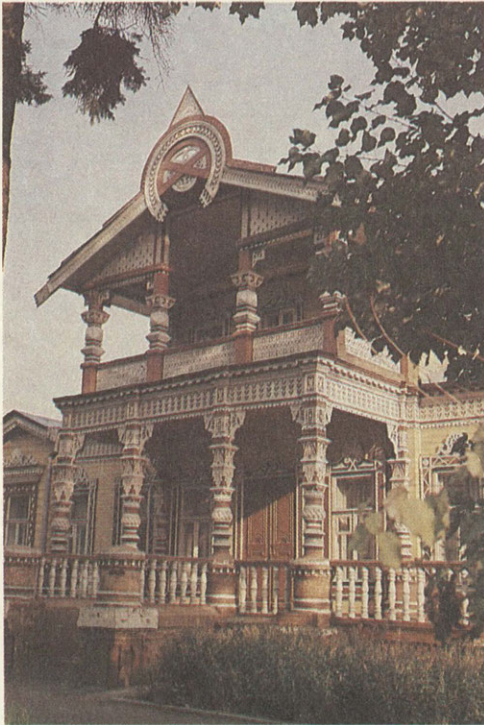
Здание исторической застройки Пензы.

На центральной улице Пензы красочное мозаичное панно напоминает о героях Кандиевского восстания 1861 года, где впервые в России восставшие крестьяне подняли красный флаг. Гранитный монолит с бронзовым горельефом — память о вожде Крестьянской войны Е. И. Пугачеве. В пятидесяти километрах от областного центра, недалеко от села Алферьевки, в красивой березовой роще сооружена стела с рельефным изображением видного ботаника А. Н. Бекетова и основателя школы физической химии Н. Н. Бекетова, родившихся в этом селе. Здесь же скульптура