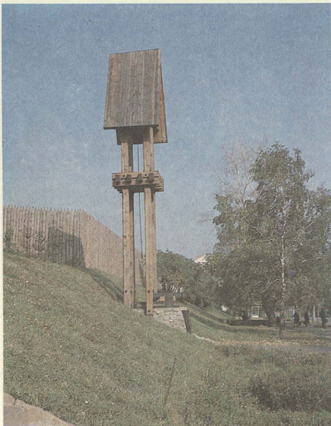
На древних валах Пензы...

мастеров широко представлены в музее предприятия. Об экспонатах музея трудно рассказать словами — их нужно видеть. Это подлинный праздник красоты, великолепного вкуса, творческой фантазии, зримый рассказ об искусстве мастеров алмазной грани. Но разве только сферой материального производства должны ограничиваться музеи профессионального мастерства? Конечно, нет.