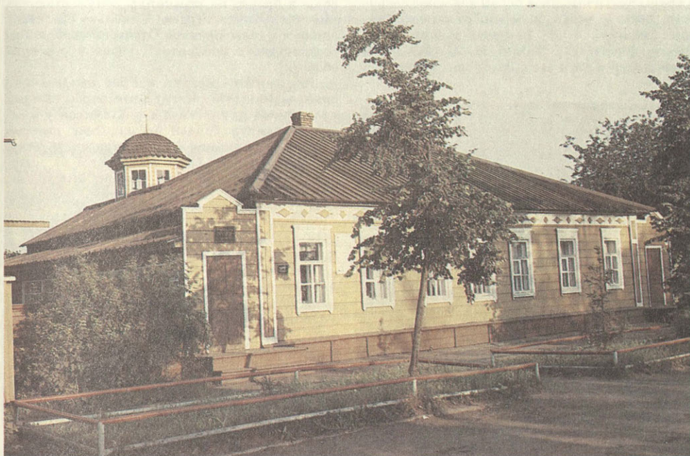
Дом-музей В. Г. Белинского.

Хочу особо сказать еще об одном деле, ко-