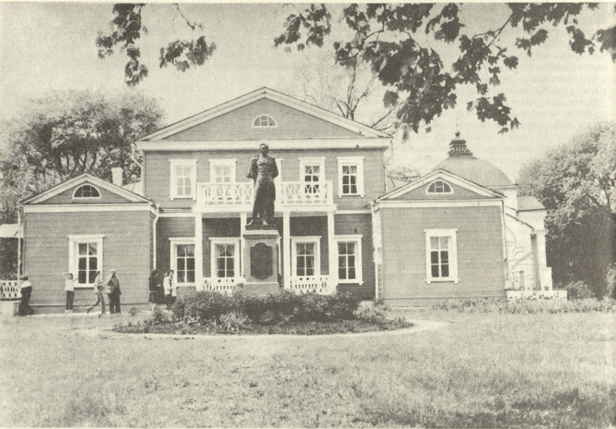
Тарханы. Музей М. Ю. Лермон- това.