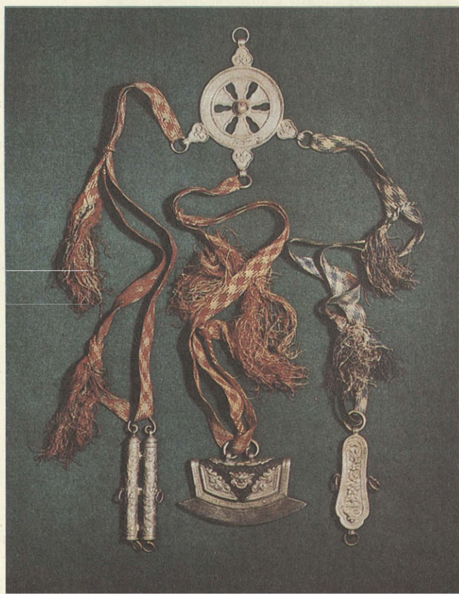
Женский пояс с украшениями. Фрагмент. Середина XIX в. Бурятия.