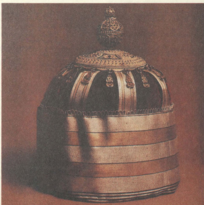
Головной убор. Середина XIX в. Кабарда.