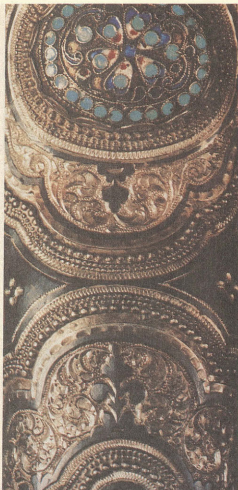
Кижал. Вторая половина XIX в. Кабардино-Балкария.