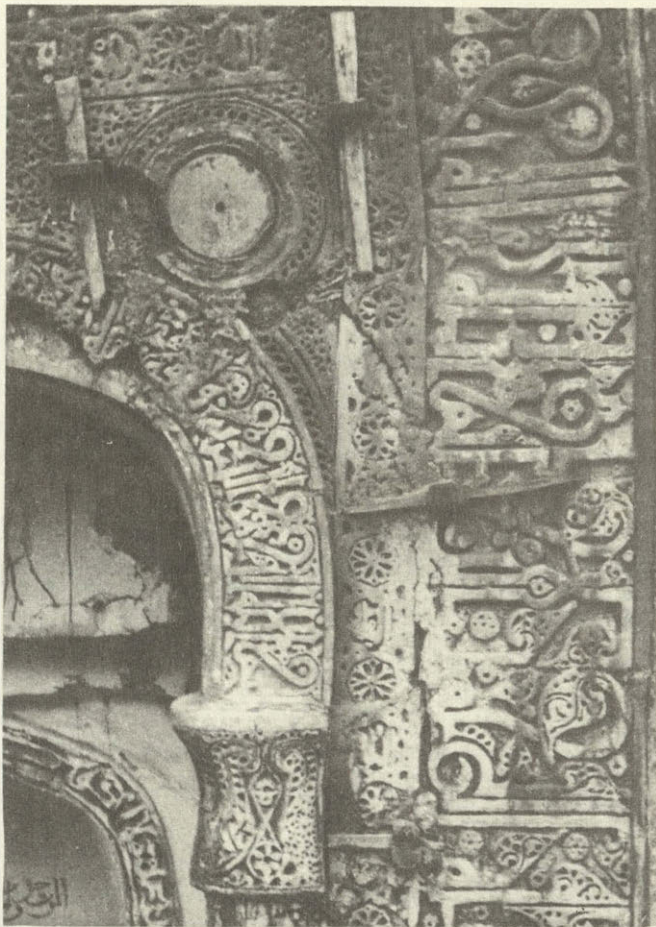
Штукковый михраб мечети в Кала-Корейш (деталь).