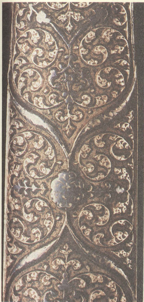
Шашка. Вторая половина XIX в. Дагестан, Кубачи.