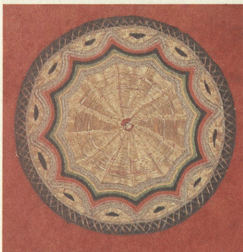
Зег — образец калмыцкой вышивки.

В начале XVII века были юридически оформлены союз и добровольное вступление калмыков в состав Русского государства. Воинская доблесть и самоотверженность кал-