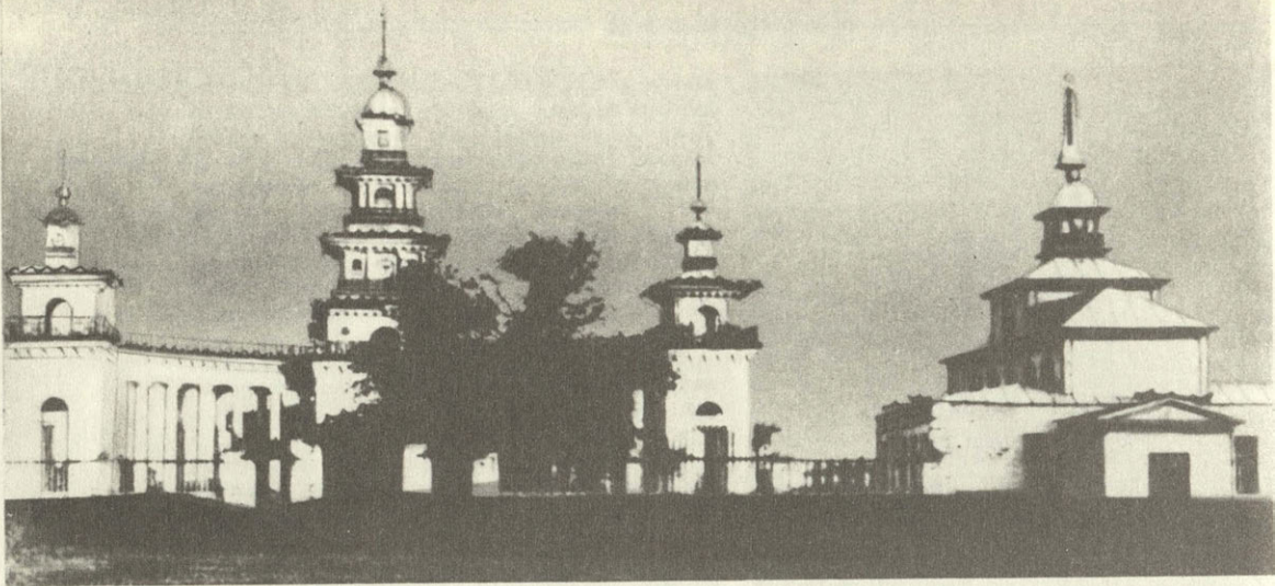
Общий вид и план памятника в бывшем Хошеутовском улице.