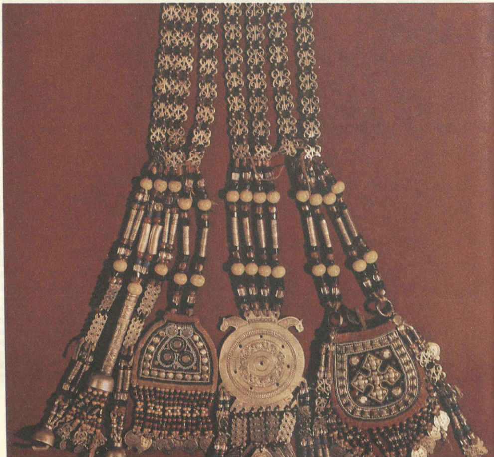
Головные украшения невесты. Середина XIX в. Якутия.

Больших успехов в деле сохранения культурного наследия Якутии добились члены Общества. В Алексеевском районе создан Черкесский мемориальный музей политической ссылки. В его организации приняла участие вся общественность района. На территории музея свезено более двадцати отреставрированных памятников народного деревянного зодчества. На всех объектах созданы экспозиции не только по истории ссылки, но и экспозиции дореволюционного быта якутов.