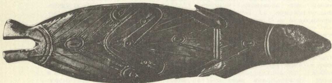
Фигура нерпы. Морской клык. Яндогай (Чукотка)