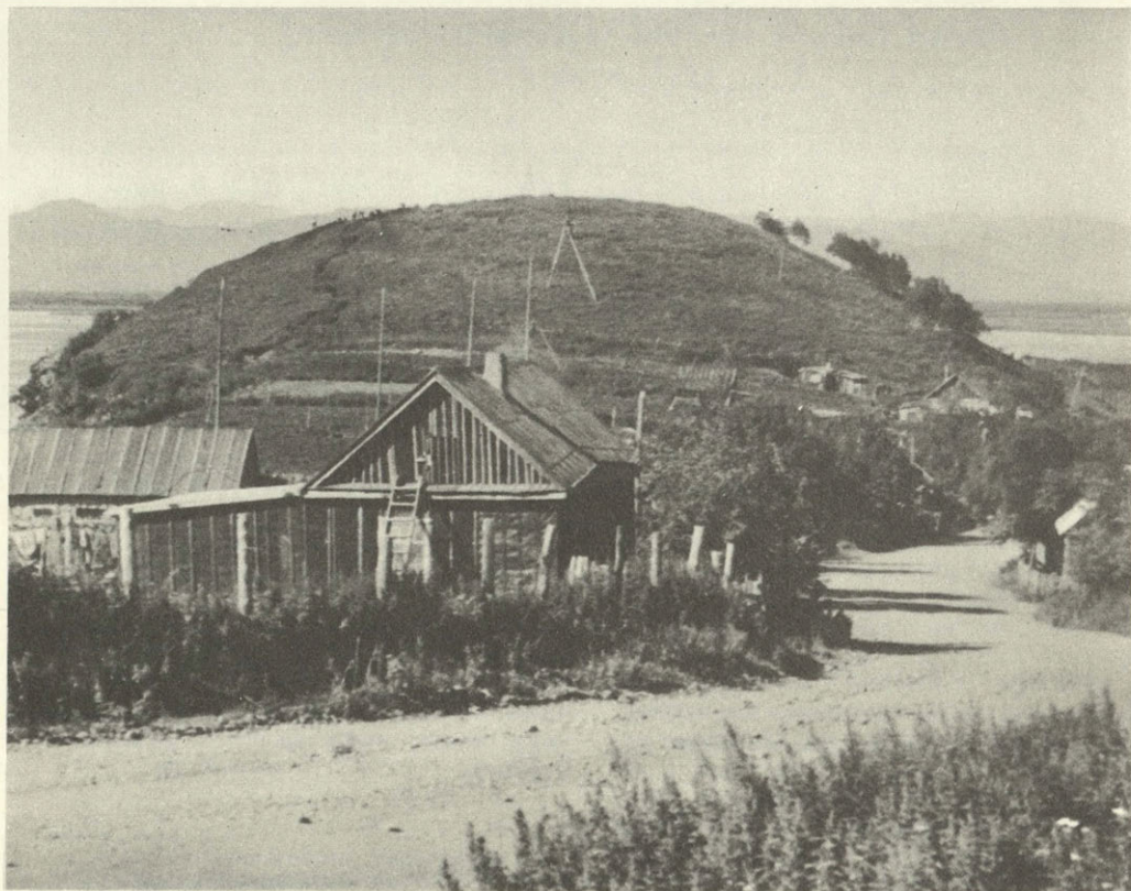
Древнеитель- менская стоянка Авача на Камчатке

Крайний северо-восток нашей страны — Камчатка, Чукотка и Приколымье — издавна является зоной расселения так называемых палеоазиатов, племен и народностей древнейшей азиатской языковой группы — чукчей, коряков, ительме-