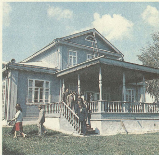
Горки Переславские. Филиал Переславского историко- художественного музея. Место, связанное с печатанием в 1895 году работы В. И. Ленина «Что такое «друзья народа» и как они воюют против социал- демократов?»

Думается, что более активную и действенную роль в вопросах пропаганды охраны памятников должны играть средства массовой информации.