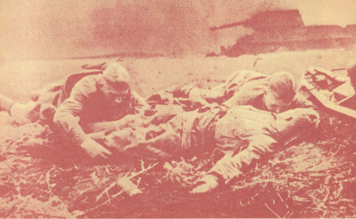
Прохоровка в 1943 году. После битвы

блюдательного пункта, расположенного на небольшой высоте юго-западнее Прохоровки, хорошо было видно поле будущего сражения.