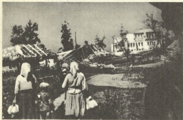
Прохоровка в 1943 году. Мирные жители возвращаются домой