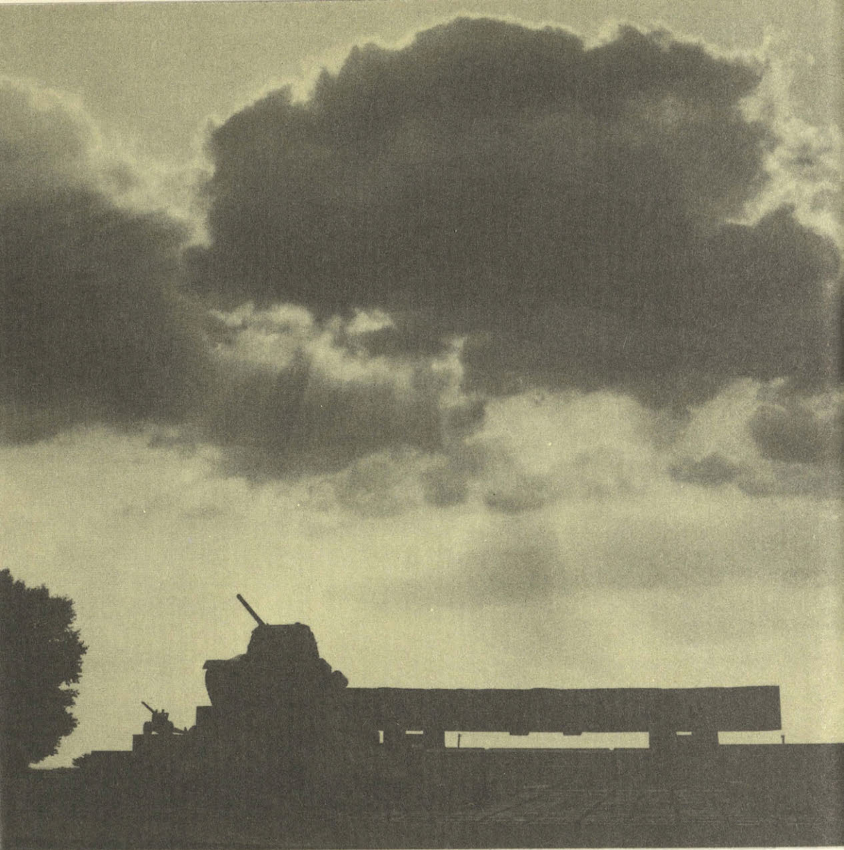
Монумент героям- танкистам в Прохоровке

скую инициативу, восстановить подорванный военный и политический престиж.