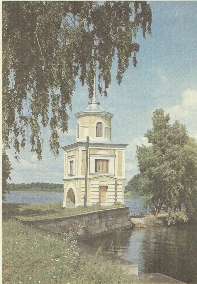
Башня Ниловой пустыни

16 мая, ранним утром, да еще в дождик, приехала за мной подвода на плохих обывательских лошадях, чтобы везти меня к Осташкову. Между Торжком и Осташковым почта не ходит, а есть так