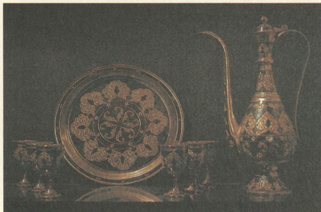
Современные изделия декоративно-прикладного искусства народов РСФСР.

Еще в 1931 году музей переехал в здание церкви Ильи Пророка на ул. Обуха (б. ул. Воронцово поле), где развернул свои экспозиции. В 30-е годы выходят в свет научные труды музея, демонстрируются выставки китайского и персид-