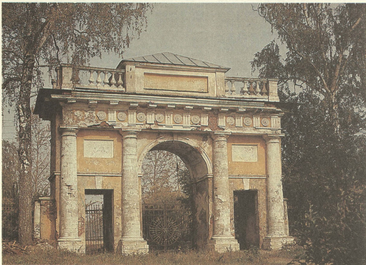
Гребнево. Триумфальная арка.

Эта история началась четыре года назад. В один из весенних дней в редакцию пришла женщина и попросила помочь ей в поисках архивных и исторических материалов о подмосковной усадьбе Гребнево.