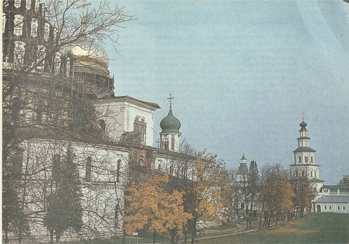
Ново-Иерусалимский монастырь. Современное фото

Бланк был крупнейшей фигурой московского архитектурного мира XVIII в. Растрелли не заглядывал в Истру, полагаясь всецело на талант и вкус Бланка, который весьма свободно распорядился полученным из Петербурга графическим материалом, придерживаясь только самой общей декоративной идеи автора и разрешая себе любые отступления.