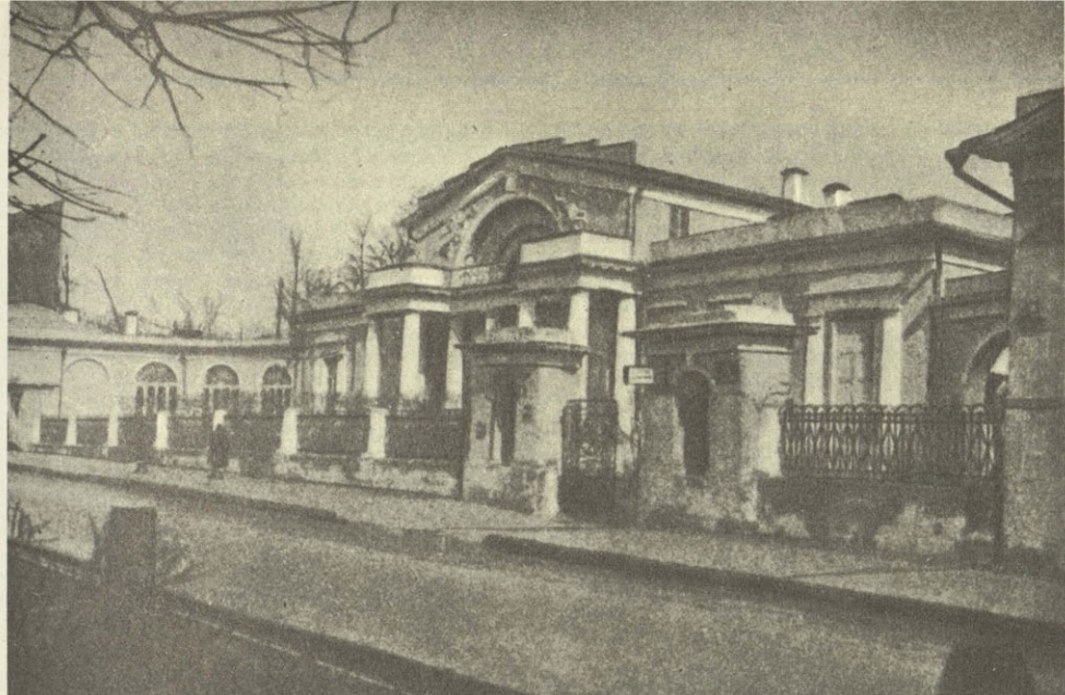
Особняк Гагарина в Москве до разрушения фашистами. Архитектор О. И. Бове