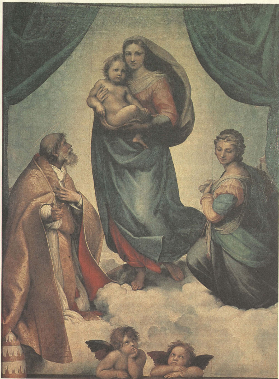
«Сикстинская мадонна» Рафаэля