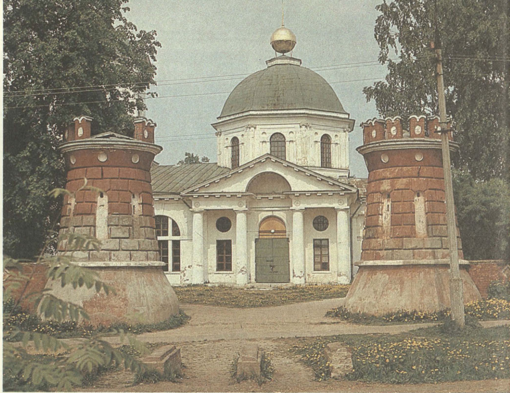
Ярополец. Современное фото