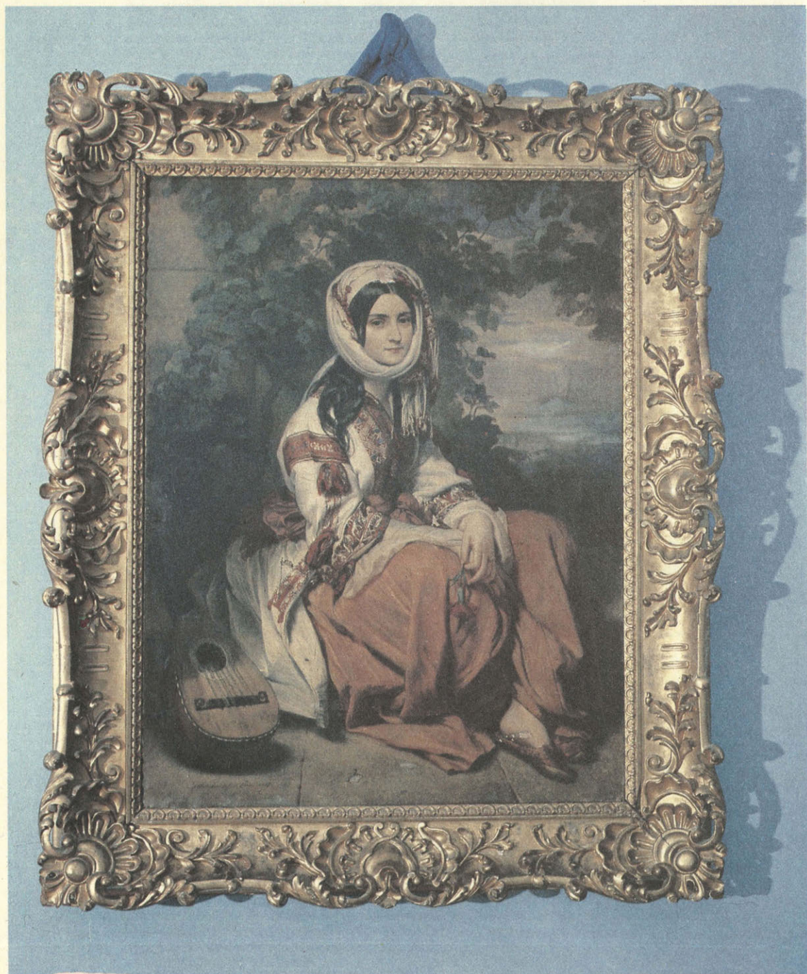
Александра Осиповна Смирнова- Россет. Портрет работы Ф.-К. Винтер- гальтера. 1837 г.