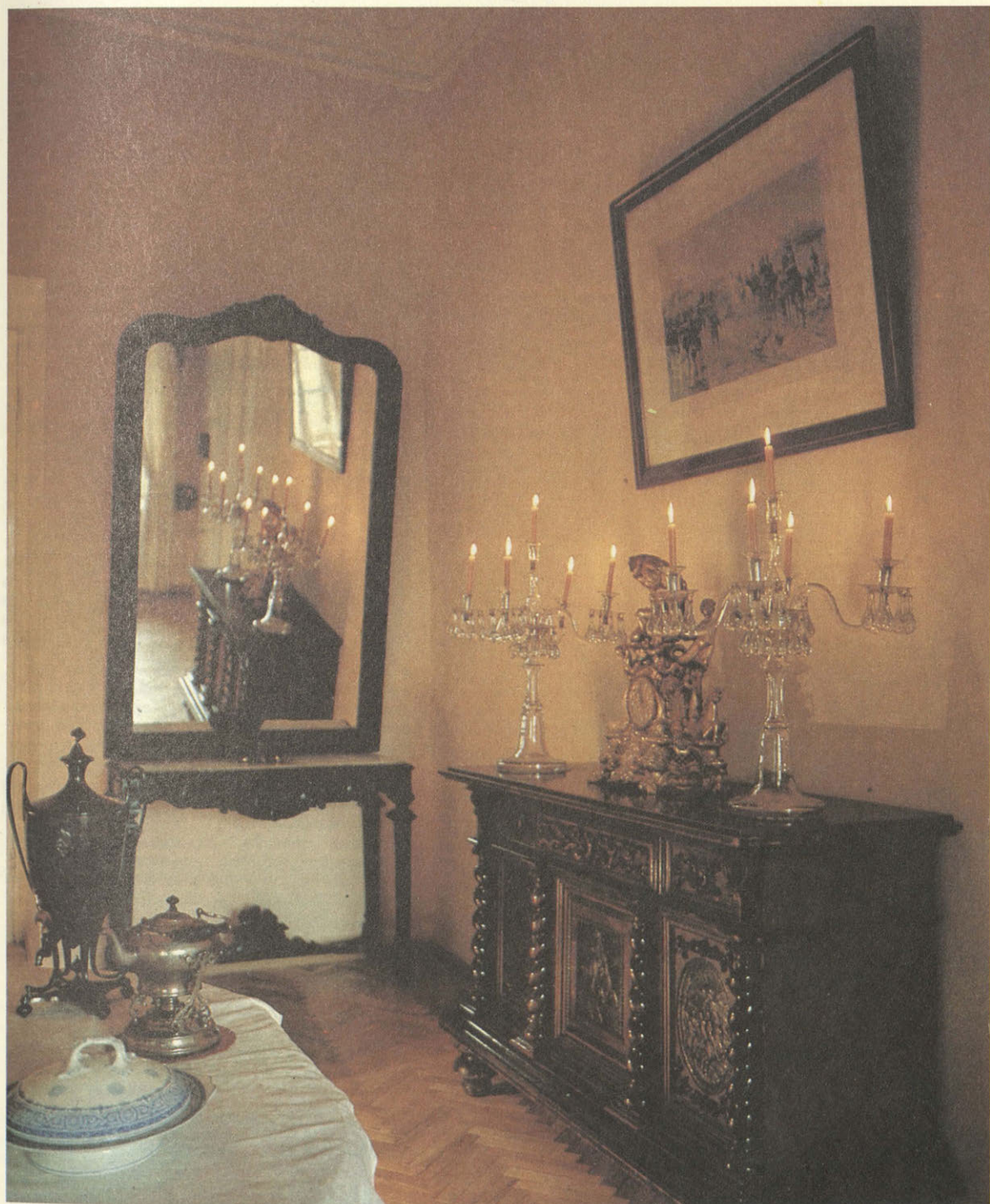
Как и полтора века назад, горят свечи