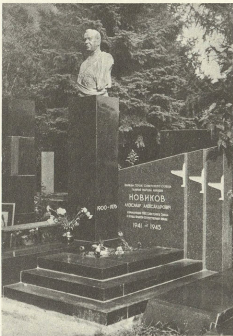
Могила А. А. Новикова

137. Курасов Владимир Васильевич (1897—1973), генерал армии. Участник граждан-