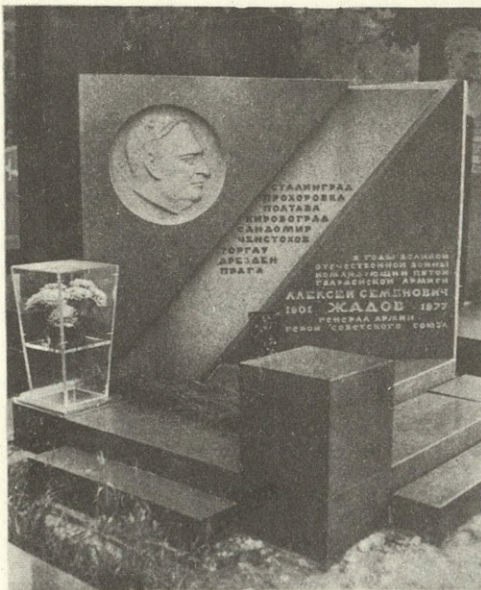
Могила А. С. Жадова

122. Казakov Василий Иванович (1898—1968), маршал артиллерии. Участник гражданской войны. Начальник артиллерии корпуса, армии, командующий артиллерией фронта. За