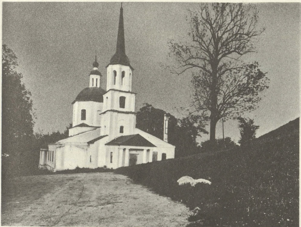
Брянск. Горне- Никольская церковь

ской ландшафт. Архитектура церкви, совместно с несколькими, ныне утраченными, домами центральной части города представляет эпоху ампира-классицизма XIX века.