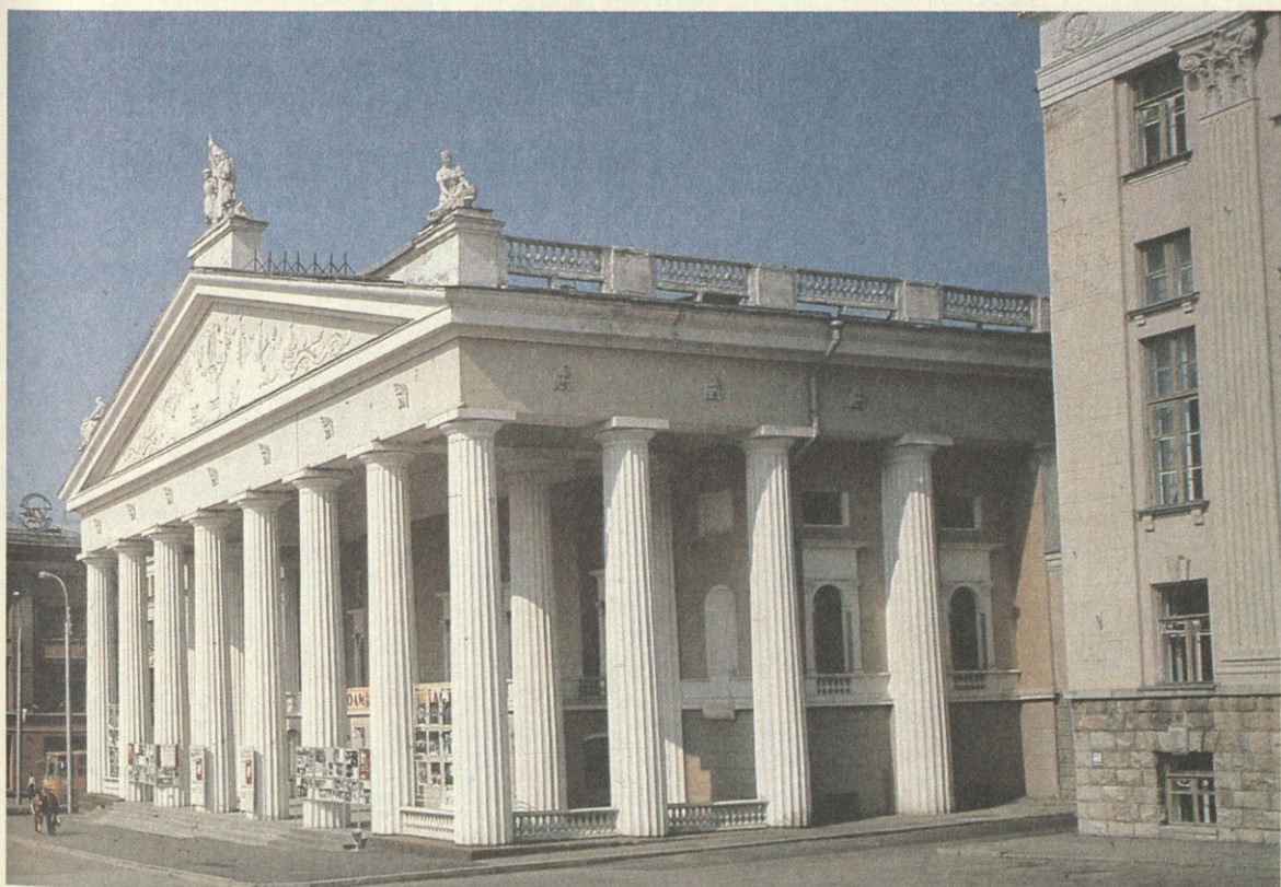
Брянск. Здание областного театра

Зона «Древний Брянск» является идейно насыщенным современным историко-культурным звеном туристской цепи по историческим и партизанским местам от Чернигова, через Брянск, Хотылево, Вщиж до Ельни. Она соприкоснется с проектируемым маршрутом «Литературное созвездие» (Орел — Брянск — Овстуг — Красный Рог), с маршрутом «Партизанская тропа» (Клетнянский заповедный партизанский лес), она раскроет целый ряд страниц славного прошлого Брянского края.