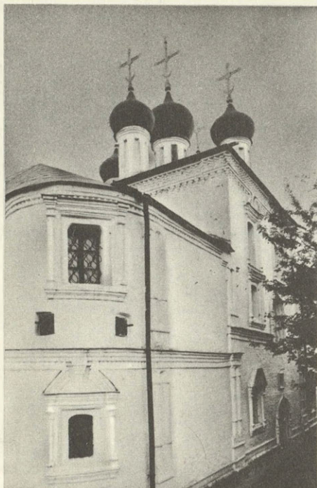
Брянск. Покровская церковь XVI в.

Несколько далее от Никольской церкви на полусклоне прибрежного холма стоит Тихвинская церковь. Усилия реставраторов вернули ей былое архитектурное звучание. Построена она была в 1769 году «ижданием прихожан при попечительстве и усердном жертво-