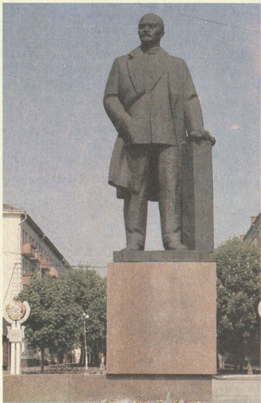
Брянск. Памятник В. И. Ленину

ное здание Советских органов — Дом Советов и в комплексе с ним — зал съездов и конференций (государственный театр) на 1200 мест.