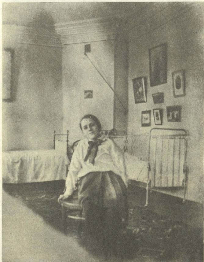
Снимков, сделанных в самом доме, почти не сохранилось. Этот — один из немногих. Старый дагерротип запечатлел детскую комнату в доме на Новинском