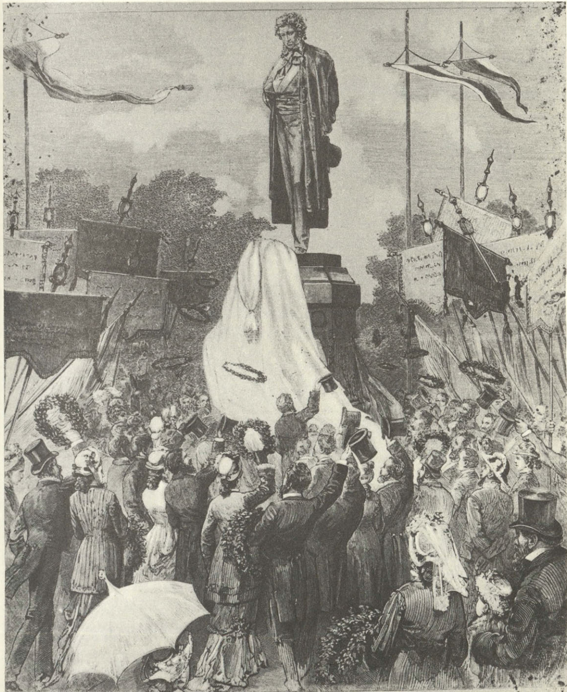
Москва. — Открытие памятника Пушкину. Момент снятия покрова.

корреспондента Н. Чехова, рисов. А. Бауман)»