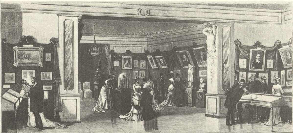
Пушкинская выставка въ залъ благороднаго собранія.

Подпись на рисунке: «Пушкинская выставка в зале Благородного собрания. Открытие памятника Пушкину в Москве 6 июня (с наброска нашего корреспондента Н. Чехова, рисов. Ф. Гапнер)»