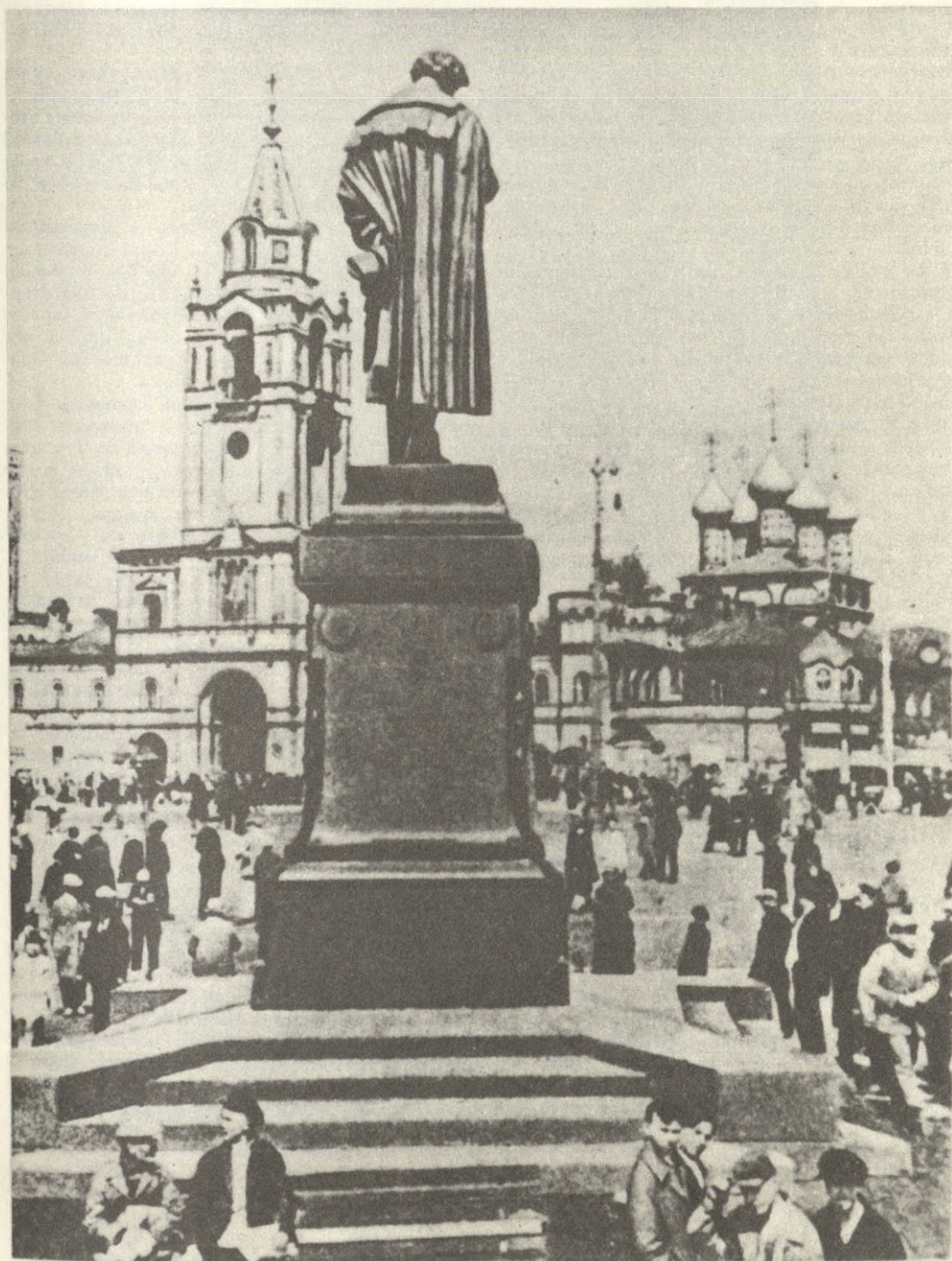
Вид на памятник А. С. Пушкину на Страстной площади. 1929 год