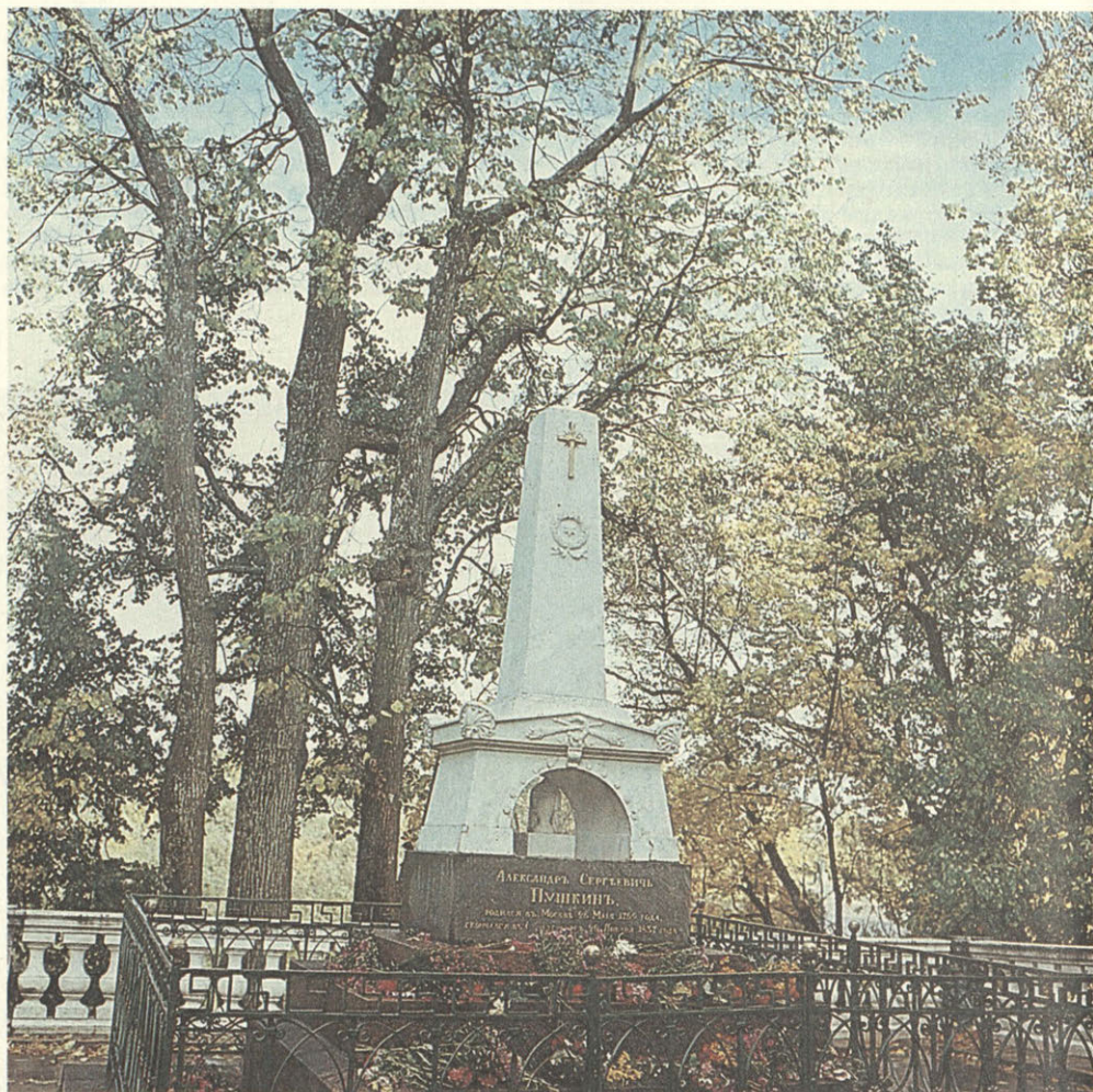
Могила А. С. Пушкина в Святогорском монастыре