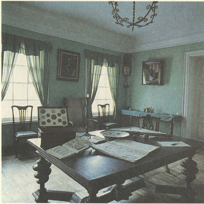
Гостиная в доме Ганнибалов

Не отрываясь от самой что ни есть реальной обстановки, Пушкин создавал в Михайловском широкий и многогранный облик современности, изображал ее через человеческие взаимоотношения. Даже, казалось бы, незначительные приметы времени, детали он умел поднимать до больших обобщений. Это особенно чувствуешь, когда сличаешь запечатленное в пушкинских строках с обстановкой и реликвиями заповедника. Все, что видишь, находясь в «гостях» у Пушкина в Михайловском, есть в его михайловских творениях.