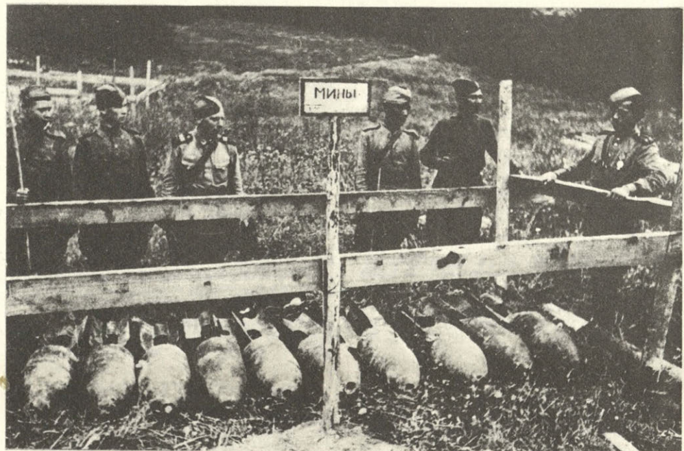
Могила А. С. Пушкина после изгнания фашистов