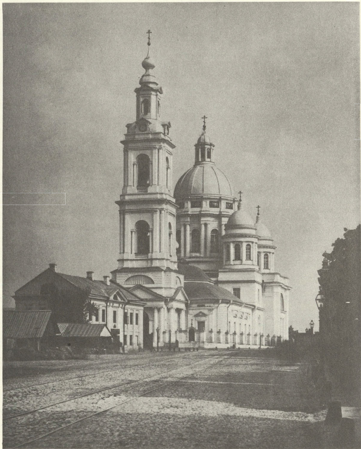
Москва. Елоховский собор, в котором крестили А. С. Пушкина.