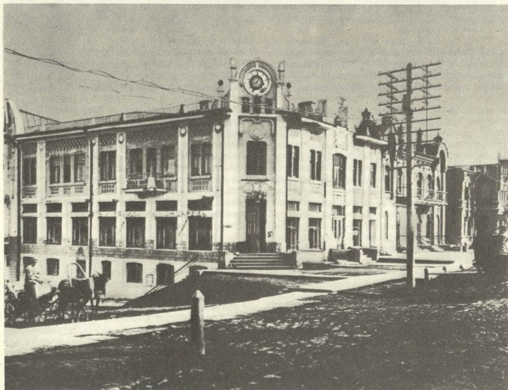
Хабаровск. Торговый дом Кривякова с магазинами Агишева. Фото 1910-х гг.

Особенно интенсивное строительство каменных зданий развернулось на рубеже веков. 27 апреля 1895 г. состоялась закладка небольшого двухэтажного здания детского (Ольгинского) приюта Хабаровского благотворительного общества. Этому торжественному событию предшествовало богослужение в Успен-