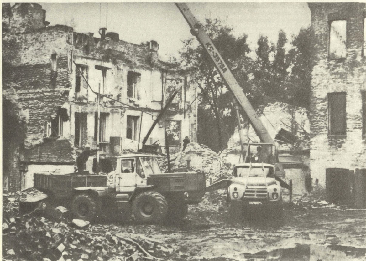
Тот же дворец в процессе разрушения. Лето 1987 г.

Земля дальневосточная богата историей. Но многое ли напоминает сегодня об этой истории, особенно о первых открывателях окраинных земель, русских казаках-первопроходцах, которые, по словам декабриста М. Бестужева, «подарили России Сибирь». Задумаемся и вспомним — все ли имена сохранили мы в памяти своей, многим ли из них памятники соорудили. Вот, скажем, имя Семена Дежнева, первым открывшего в 1648 г. пролив, разделяющий Азию и Америку. Но нет ему памятника в Хабаровске, хотя вопрос об этом был поставлен Приамурским отделом Русского Географического общества ровно 80 лет назад. Был объявлен конкурс и сбор по-