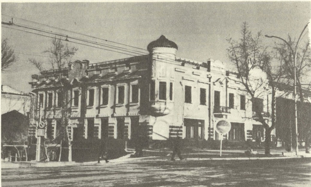
Хабаровск. Здание бывшего отеля «Русь»

этап деревянного строительства продолжался вплоть до 1917 г. Количество деревянных домов во много раз преобладало над каменными, которые стали появляться в городе лишь спустя четверть века после его основания. Например, с 1884 по 1900 г. было построено чуть более двадцати капитальных сооружений. Основной период строительства каменных зданий — последнее десятилетие XIX и 15 лет нового, XX столетия. За это время были воз-