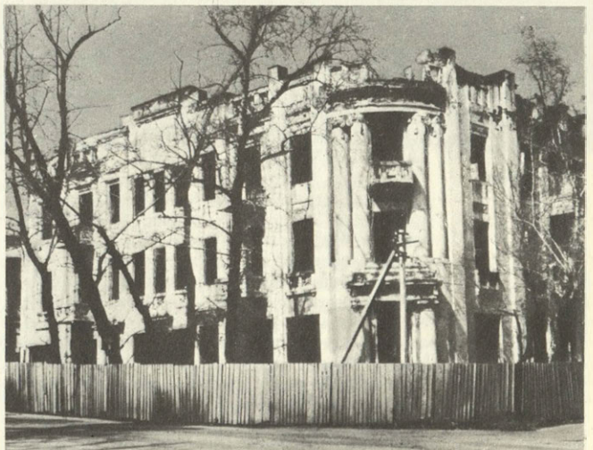
Тот же дворец. Состояние 1987 г.