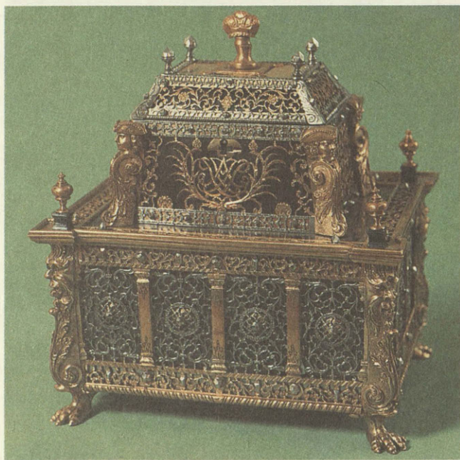
Ларец Петра I

Лицевое шитье, помимо своих художественных качеств, — ценный исторический источник, часто интересный своими вкладными надписями. «Лета 7095-е повелением государя царя и великого князя Федора Ивановича всея Руси и его царицы и великой княгини Ирины божиею милостью государя великого князя Ивана Васильевича всея Руси сын его царевич князь Димитрий Иванович Углицкой сий покров приложил Кирилу Белозерьскому чудотворцу за их государево здоровье и за свое и за мать свою царицу и великую княгиню Марию» — такова надпись на покрове, связанном с именем царицы Марии Федоровны Нагой, матери царевича Димитрия, убитого в Угличе.