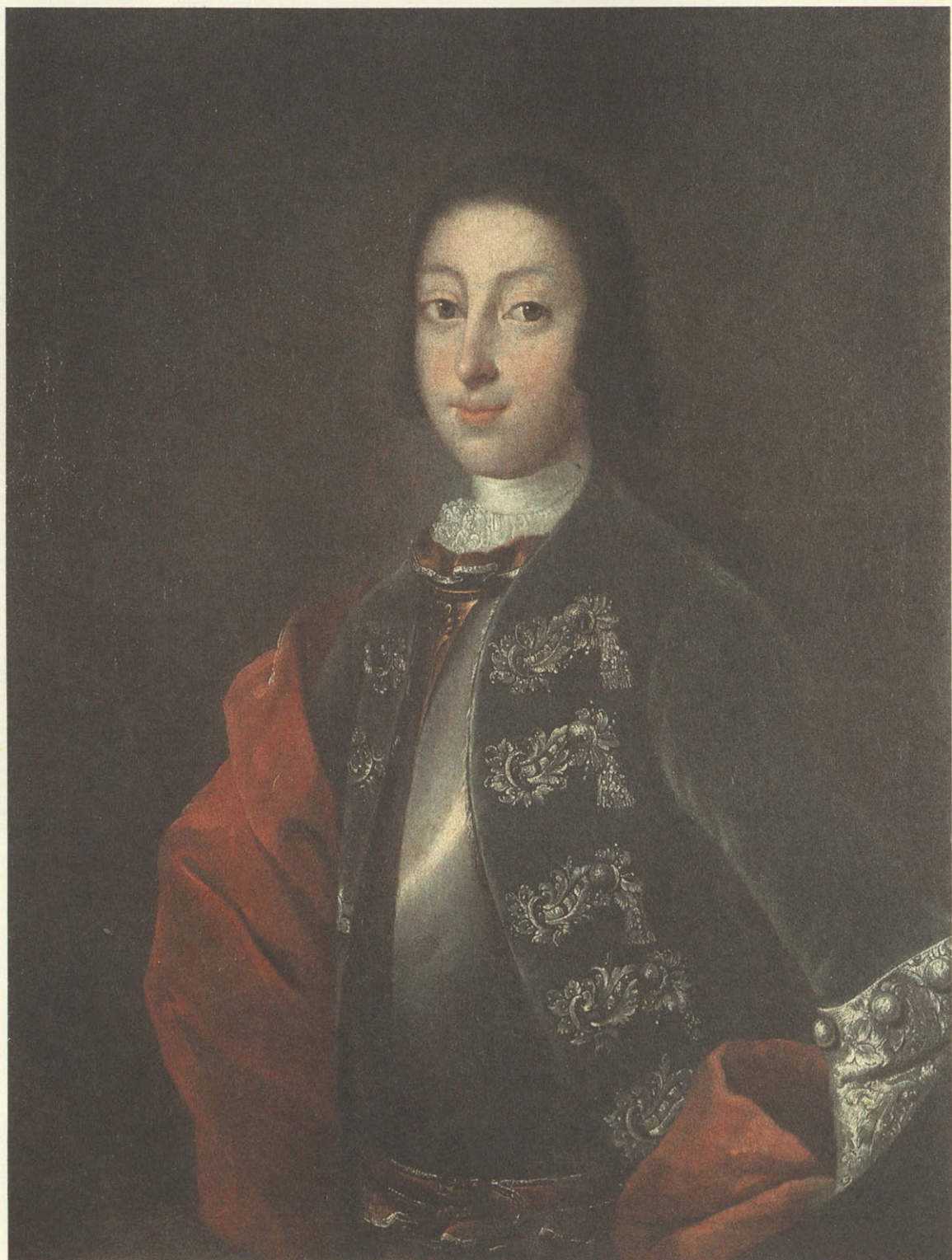
Портрет великого князя Петра Федоровича. I четверть XVIII века