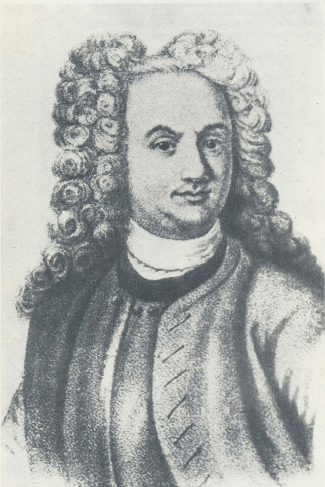
Литография с портрета В. Н. Татищева

в той или иной форме занимало немалое место в общественной жизни и больших и малых городов. Но краеведческое движение (если допустимо применительно к XIX — началу XX в. такое словоупотребление) было, конечно, неоднородно, ибо значение краеведных знаний в формировании историко-культурных