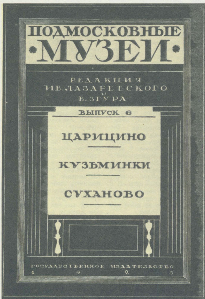
Одно из первых советских изданий по краеведению

Сначала решили сосредоточить усилия на подмосковных усадьбах. Как вспоминает