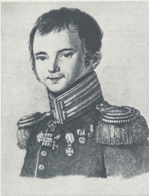
Ф. Н. Глинка. С гравюры 1823 г.

В другой августовской заметке 1828 г. рассказывалось о посещении Петрозаводска раз-