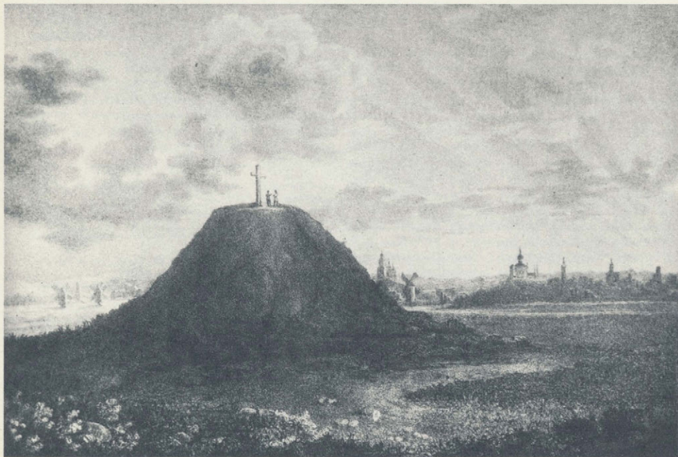
Курган Петра Великого под Полтавой или Шведская могила