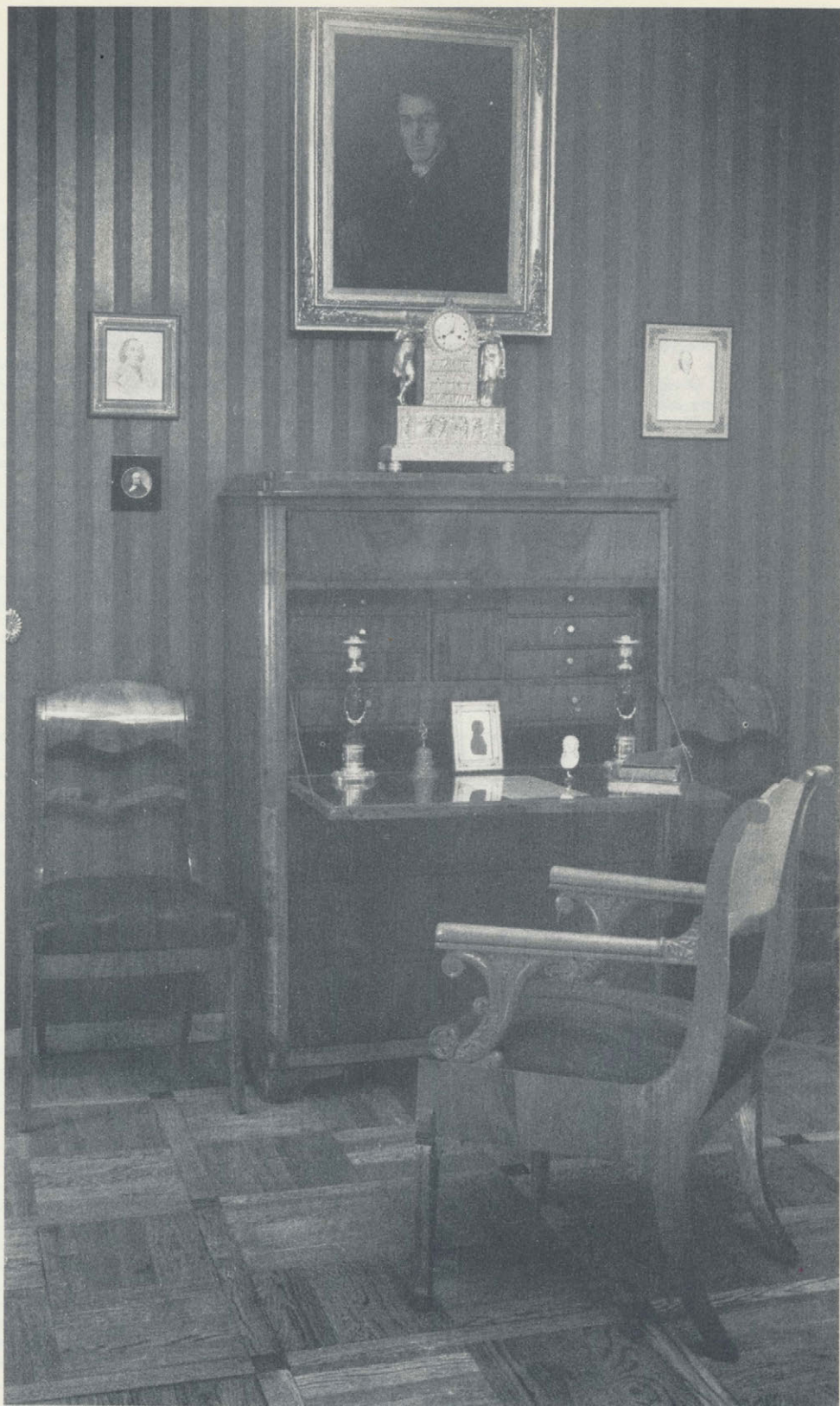
Интерьер дома-музея А. И. Герцена в Москве