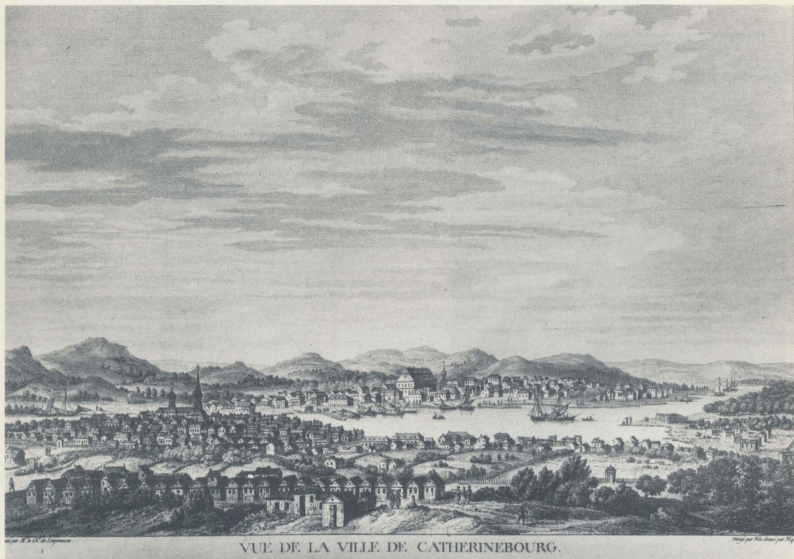
VUE DE LA VILLE DE CATHERINEBOURG.

Вид города Екатери́нбурга. Гравюра начала XIX в.