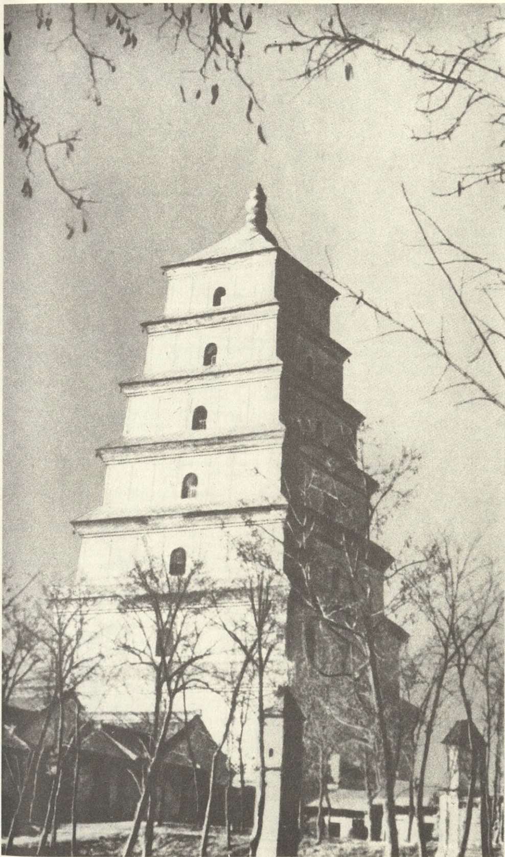
Пагода. Даяньта. Сиань. Китай