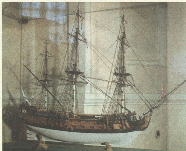
Модель флагманского линейного корабля «Евстафий».