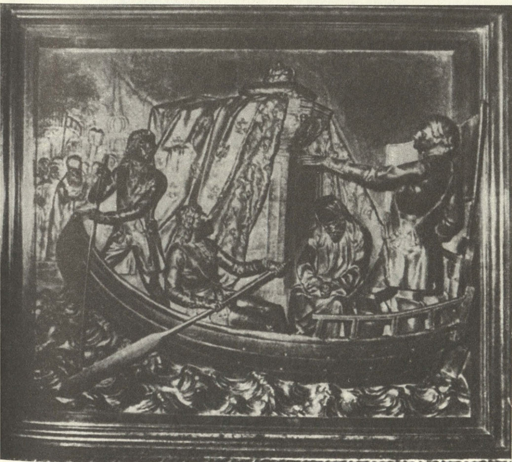
«Петр I перевозит на ботике мощи Александра Невского». Горельеф врат Исаакиевского собора.