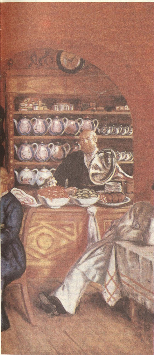
Сцена русской жизни. Чаяпение. Б. М. Кустодиев. «Московский трактир».

Расцвело в Валдае и кузнечное дело. До 50 кузниц было в городе в начале XIX века, а в 1844 г. — почти 100. Изготовляли не только разную мелочь, но и сельскохозяйственные орудия. Телеги, тарантасы, расписные дуги