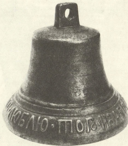
1813 г. «Сей ко. лит Валдае. Кого люблю, того и дарю» — надпись на колокольчике.

Убедившись на своем семидесятилетнем опыте в губительной разрушительности насильственной социальной «сверхдинамики», когда срывались с мест, переселялись, перемешивались громадные массы людей (переселения целых народностей, принудительные и добровольные миграции на «великие стройки», целину и пр.), когда миллионы людей, вырванных с коренных мест, образовывали «новую социальную общность» барачного, общежитского или квартирно-коммунального типа, мы теперь как библейский блудный сын припадаем к развалинам разгромленной культуры и начинаем, наконец, понимать, насколько прав был поэт, мудро сказавший нам, что на свете счастья нет, а есть покой и воля. Мы начинаем, наконец, ценить вечное, обще-