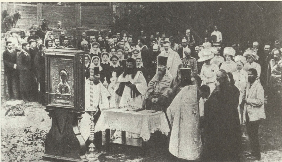
Крестный ход. Кострома. 1900.

вынесенная из храма, оставалась целой, даже краски на ней не поблекли. Жители Городца, те, которые некогда спаслись от татар и попали в Кострому, узнали «свою» икону. Как поется в Акафисте Феодоровской иконе Божией Матери: «Видевше жителie града Городца образ Твой, Владычице, во храме града Костромы стоящий, и на руку твою держима Богомладенца Иисуса, скорбию одержима беша: зане отшествие его бысть из града их». Они же рассказали костромичам о чудесах, совершавшихся силою этой иконы в Городце. Чудеса продолжались и в Костроме. На месте обретения иконы князь Василий построил монастырь с церковью во имя Спаса Нерукотворенного. А после пожаров в храме Феодора Стратилата повелел начать строительство каменного собора над Волгой — в честь Успения Божией Матери. Это день 15 августа по старому стилю.