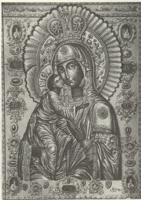
Чудотворная икона Федоровской Божией Матери. Со старинной гравюры.

Икона Владимирской Божией Матери. С этой иконой московское посольство просило Михаила Романова на царство.