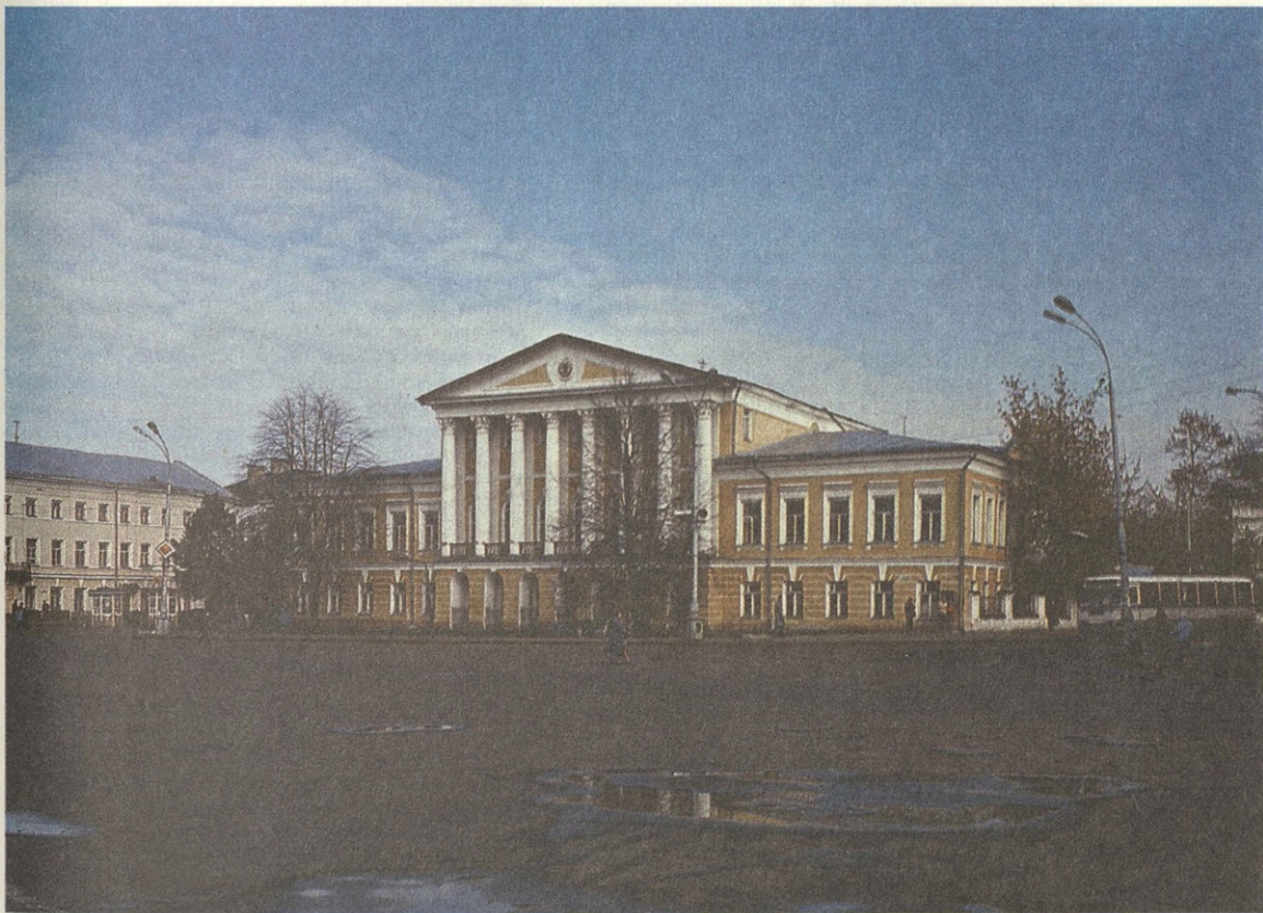
Дом Борщова. Кострома.

Летом 1858 года приезжает в Кострому и останавливается в гостинице «Лондон»